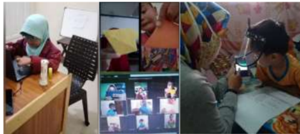
Gambar 5. Peran Orang Tua dalam Proses Pembelajaran Online

Tanpa adanya orangtua yang mendampingi hanya segelintir anak yang bisa mandiri mengikuti kegiatan dalam jaringan (daring) dan sebagian besar lainnya masih butuh bantuan orangtua dalam mendampingi (p.7)