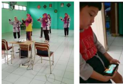
Gambar 4. Efektivitas Pembelajaran Online

Pembelajaran online tidak seefektif kegiatan pembelajaran tatap muka, salah satunya disebabkan oleh jaringan internet yang kurang stabil sehingga menyebabkan proses pembelajaran online terkadang terputus secara tiba-tiba dan terkadang bahkan tidak tersambung sama sekali (p.2).