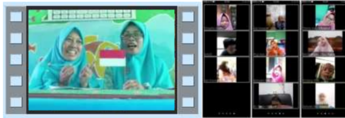
Gambar 3. Proses Pembelajaran Online

Guru membuat rencana kegiatan, materi pembelajaran, bahan ajar dan video pembelajaran untuk digunakan dalam proses pembelajaran online (p.11).