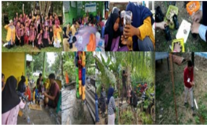
Gambar 2. Kegiatan yang terkait tema hidup sehat dan manajemen sampah