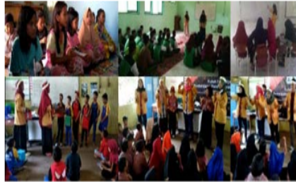
Gambar 4. Program tematik perpustakaan dan penumbuhan minat baca bagi anak SD dan SMP

termasuk pembuatan POC, b). pengasapan ikan c). Pengolahan produk ikan