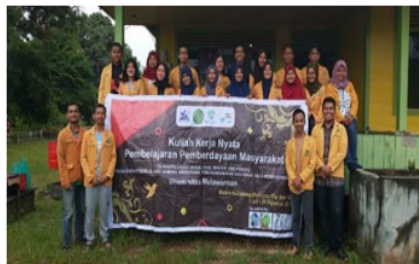
Gambar 5. Kegiatan monitoring dan Evaluasi oleh dosen pendamping lapangan (DPL) di posko KKN PPM

Kegiatan KKN PPM ini juga mendapatkan monitoring dan Evaluasi dari dosen pendamping lapangan. Pada hari ke 30, dosen pendamping lapangan mengunjungi posko KKN dan lokasi kegiatan serta wawancara peserta KKN PPM. Tiap peserta dimonitoring dan Evaluasi tentang jalannya kegiatan, kendala yang dihadapi, dan penyelesaian kegiatan yang belum selesai. Kegiatan monitoring dan Evaluasi ini berlangsung selama dua hari di lokasi kegiatan (Gambar 5).