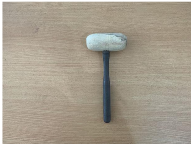
Gambar 5. Tabuh gamelan bentuk bilah (Instrumen Saron )