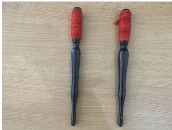
Gambar 1. Tabuh gamelan bentuk pencon

Tabuh atau alat pemukul gamelan Jawa dengan bentuk pencon terbuat dari kayu dengan panjang sekitar 30-40 cm. Tabuh memiliki dua sisi atau bagian dimana sisi atas yang digunakan sebagai media untuk dipukulkan ke instrumen, dibalut dengan tali kenur agar menghasilkan bunyi yang lebih soft . Kemudian sisi bawah dibuat agak lebih mengecil dibandingkan sisi atas yang digunakan untuk tangan musisi gamelan/ pengrawit memegang tabuh . Berikut adalah tabuh gamelan bentuk pencon tersebut.