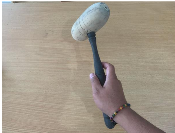
Gambar 7. Teknik memegang tabuh instrumen Demung dan Saron

Pada gamelan Jawa yang berbentuk bilah, dimainkan dengan satu tangan. Instrumen gamelan yang berbentuk bilah yang dimainkan dalam pembelajaran pada matakuliah ini adalah instrumen Demung , Saron , dan Slenthem . Teknik dalam memegang tabuh yang berbentuk bilah ini adalah tangan musisi memegang tabuh pada bagian tengah pada sisi bawah tabuh. Untuk lebih jelasnya bisa dilihat pada gambar berikut ini: