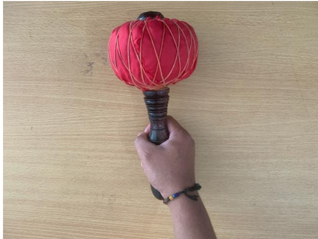
Gambar 11. Teknik memegang tabuh instrumen Kempul