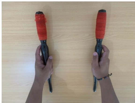
Gambar 3. Teknik memegang tabuh pencon dengan dua tangan