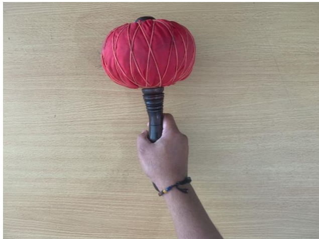
Gambar 12. Teknik memegang tabuh instrumen Gong