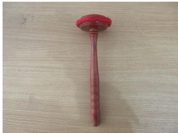
Gambar 6. Tabuh gamelan bentuk bilah (Instrumen Slenthem )