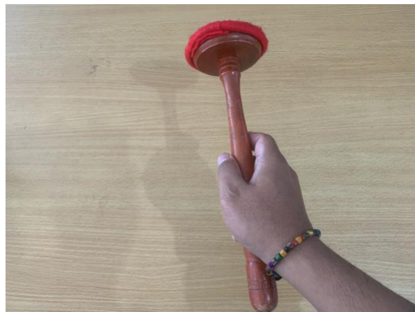
Gambar 8. Teknik memegang tabuh instrumen Slenthem