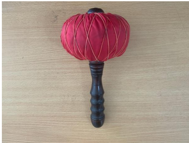
Gambar 10. Tabuh instrumen Gong

Pada instrumen gamelan Jawa yaitu Kempul dan Gong , dimainkan dengan satu tangan. Teknik dalam memegang tabuh untuk instrumen ini adalah tangan musisi memegang tabuh pada bagian tengah pada sisi bawah tabuh . Untuk lebih jelasnya bisa dilihat pada gambar berikut ini: