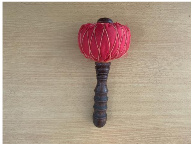
Gambar 9. Tabuh instrumen Kempul

untuk instrumen Gong . Tabuh kempul berbentuk lebih kecil sedangkan tabuh gong berbentuk lebih besar. Tabuh memiliki dua sisi atau bagian dimana sisi atas yang digunakan sebagai media untuk dipukulkan ke instrumen, berbentuk lingkaran yang didalamnya terdapat kain yang ditata sedemikian rupa dan ditutup dengan satu kain utuh yang diikat dengan tali untuk mengencangkan. Kemudian sisi bawah dibuat dengan kayu memanjang yang digunakan untuk tangan musisi gamelan/ pengrawit memegang tabuh . Berikut adalah tabuh gamelan untuk instrumen kempul dan gong tersebut.