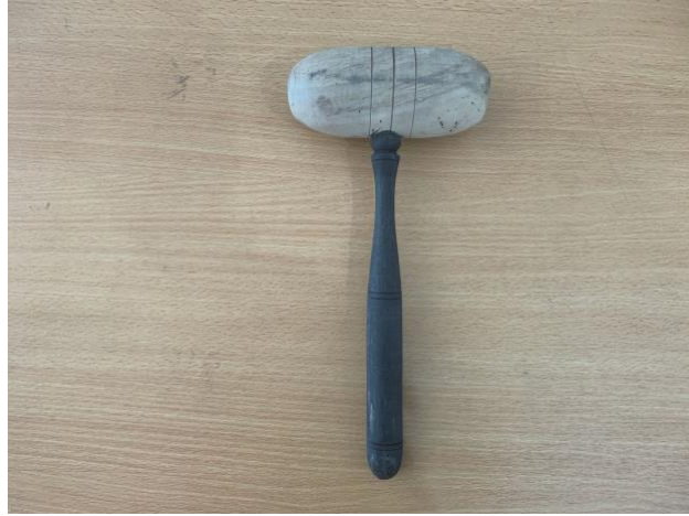
Gambar 4. Tabuh gamelan bentuk bilah (Instrumen Demung )

kayu memanjang yang digunakan untuk tangan musisi gamelan/ pengrawit memegang tabuh . Berikut adalah tabuh gamelan bentuk bilah tersebut.