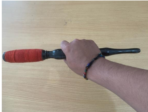
Gambar 2. Teknik memegang tabuh pencon dengan satu tangan