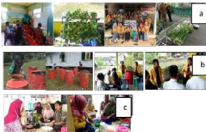
Gambar 3. Program tema Kemandirian pangan, a) hidroponik,

Dalam program ini, kegiatan yang telah dijalankan adalah sebagai berikut: penyuluhan minat baca, bimbingan materi (BIMA), Rumah belajar mengajar di sekolah SD dan SMP setempat dan tangga baca (Gambar 4).