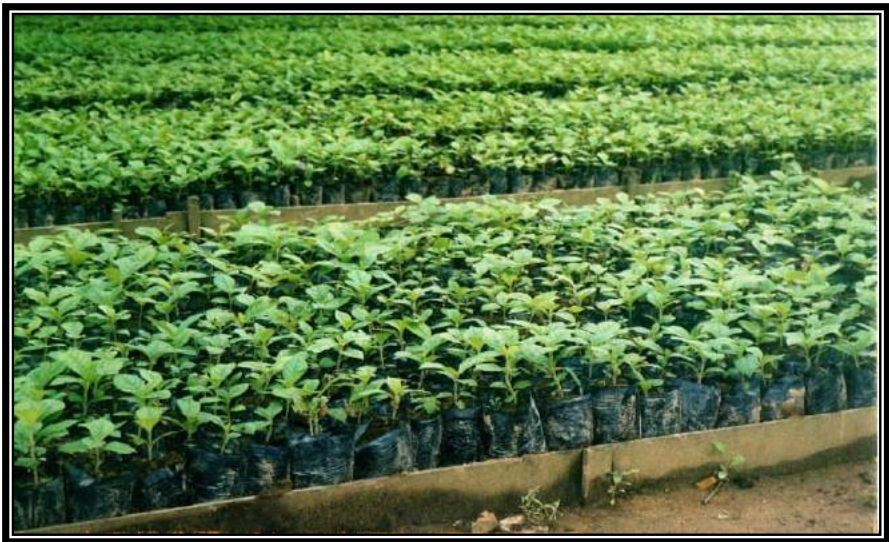
Gambar 2.1. Bibit jati di persemaian milik masyarakat di Teluk Dalam Sebulu Kab. Kutai Kartanegara