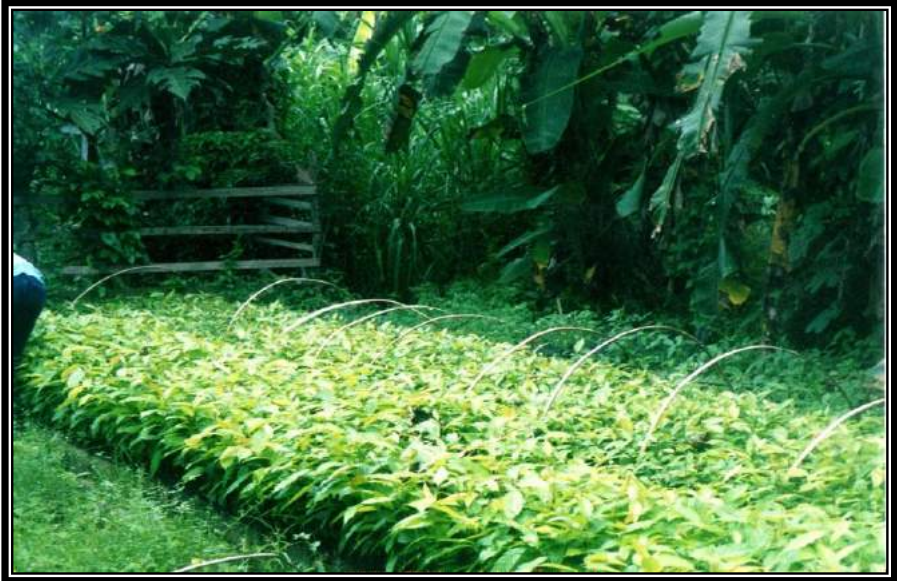
Gambar 2.4. Bibit mahoni di persemaian milik masyarakat di Kebon Agung Samarinda.