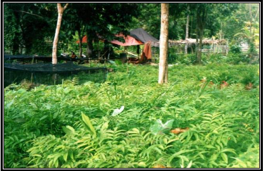
Gambar 2.2. Bibit sungkai di persemaian milik masyarakat di Kebon Agung Samarinda