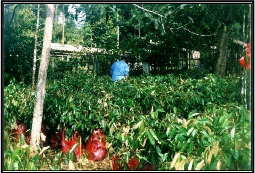
Gambar 2.3. Bibit durian di persemaian Pusat Penelitian Hutan Tropis (PPHT) di Bukit Soeharto. Bibit siap diangkut ke lapangan.