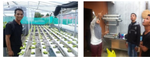
Gambar 3. Kunjungan dan konsultasi hidroponik di teras hidroponik (Gambar kiri) dan Graha Indah Farm (Gambar kanan) di kota Samarinda.

Selain berdiskusi dengan tim pengabdian dan aparat, diskusi juga dilakukan dengan pengusaha hidroponik di Samarinda yang telah memiliki banyak pengalaman dalam usaha hidroponik Ada 2 tempat yang dijadikan sebagai tempat diskusi yaitu di Teras Hidroponik yang beralamat di Jl. Padat Karya gang Karya Mandiri 6 No.34, Sempaja Utara dan di Graha Indah Farm yang beralamat di Jl. Graha Indah, Blok R No.6, Air Putih, Samarinda Ulu (Gambar 3).