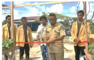
Gambar 5. Peresmian pusat hidroponik desa Sidomulyo dengan pemotongan pita secara simbolis oleh aparat desa