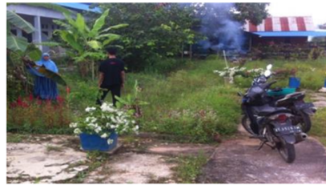
Gambar 2. Peninjauan lokasi tempat pembuatan pusat hidroponik di lahan masyarakat Sidomulyo

Setelah dilakukan tinjauan ulang masyarakat sasaran dan didapatkan hasil berupa gambaran umum pelaksanaan lokasi pembentukan pusat hidroponik serta beberapa kendala yang mungkin terjadi saat pelaksanaan program, kemudian telah dilakukan diskusi dengan tim pengabdian masyarakat dan aparat terkait untuk mendapatkan solusi dan rumusan strategi yang tepat saat menjalankan program.