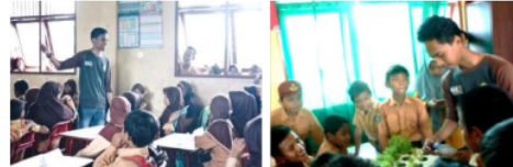
Gambar 6. Sosialisasi kepada siswa-siswi Sekolah Dasar (SD) Desa Sidomulyo

hidroponik, peluang usaha hidroponik serta rencana menjadikan Desa Sidomulyo menjadi Desa Wisata Hidroponik. Pada tanggal 20 Mei 2017 telah dilakukan sosialisasi kepada siswa-siswi di Sekolah Dasar (SD) yang berada di Desa Sidomulyo yaitu SDN 008 Anggana dan SDN 009 Anggana (Gambar 6). Dalam sosialisasi ini siswa-siswi tersebut dibekali mengenai cara bercocok tanam hidroponik (sistem terapung) dan dikenalkan pusat hidroponik yang telah dibangun di Desa Sidomulyo sebagai lokasi wisata pendidikan agroforestri.