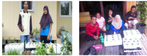
Gambar 10. Lomba project design

Kegiatan lomba tiap RT bertujuan untuk memacu semangat masyarakat untuk mendapatkan hasil yang terbaik dan menjadi percontohan bagi masyarakat lain. Kegiatan ini diawali dengan membagikan satu set perlengkapan hidroponik yang telah disiapkan kepada perwakilan setiap RT, penilaian dilakukan setelah kurang lebih 3 minggu penanaman. Dalam kegiatan ini yang berhasil sebagai RT terbaik adalah RT 12. Penghargaan untuk beberapa nominasi pemenang berupa starter kit hidroponik (Gambar 10).