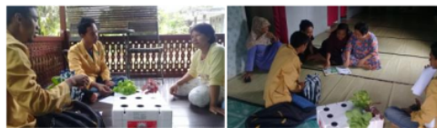
Gambar 7. Sosialisasi hidroponik ke masyarakat

Setelah sosialisasi kepada siswa-siswi Sekolah Dasar (SD), pada tanggal 4 Juni 2017 dilakukan pula sosialisasi kepada masyarakat umum di Desa Sidomulyo dengan mendatangi masyarakat dan rumah ke rumah (Gambar 7). Sosialisasi yang dilakukan berupa pengenalan rencana menjadikan Desa Sidomulyo menjadi Desa Wisata Hidroponik dan cara bercocok tanam secara hidroponik dengan sistem terapung. Dan hasil sosialisasi ini didapatkan 6 rumah dan 3 RT di Desa Sidomulyo. Selain dari rumah ke rumah, sosialisasi kepada masyarakat umum juga dilakukan pada saat peresmian desa wisata hidroponik mengenai peluang bisnis hidroponik serta mengajak masyarakat untuk dapat mengembangkan desa wisata hidroponik yang telah dibangun. Sosialisasi ini dilanjutkan dengan pemberian perlengkapan hidroponik dengan sistem sumbu kepada perwakilan 3 RT dan satu kelompok PKK dengan harapan dapat menjadi pelopor Desa Wisata Hidroponik.