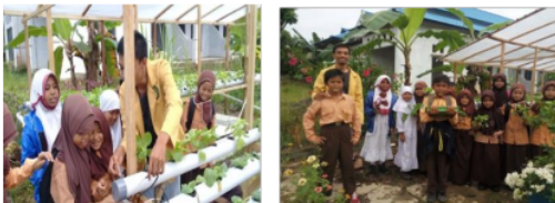
Gambar 9. Kunjungan siswa SD ke pusat hidroponik sebagai desa wisata pendidikan siswa-siswi SD Sidomulyo

Dalam melaksanakan project design ini ada 2 pembagian yaitu melakukan lomba pada tiap RT dan wisata pendidikan agroforestri berupa kunjungan dan siswa-siswi sekolah dasar ke pusat hidroponik. Wisata pendidikan agroforestri ini sudah tercapai dengan terbentuknya pusat hidroponik sebagai sarana edukasi bagi siswa SD dan dengan kunjungan dan siswa-siswi SD ke pusat hidroponik, hal ini menjadi langkah awal yang bagus untuk menarik siswa-siswa untuk berkunjung ke pusat hidroponik (Gambar 9).