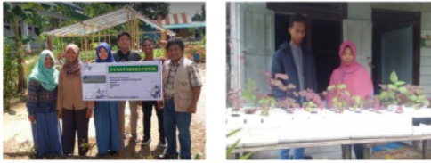
Gambar 8. Sosialisasi dan mempromosikan ke masyarakat tentang pusat hidroponik yang menyediakan peralatan dan sayuran hidroponik

dapat dibeli di pusat hidroponik desa Sidomulyo (Gambar 8).