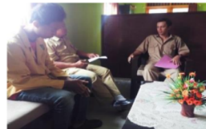
Gambar 4. Koordinasi pembukaan pusat desa wisata hidroponik desa Sidomulyo ke kepala aparat desa Sidomulyo

Untuk dapat mengeksekusi program ini, maka pada tanggal 04 April 2017 telah dilakukan kunjungan ke Kantor Desa Sidomulyo dengan tujuan untuk mengkonfirmasi kegiatan yang akan dilaksanakan di Desa Sidomulyo. Pada kunjungan tersebut, Kepala Desa dan aparat desa sangat mendukung kegiatan yang akan dilaksanakan (Gambar 4).