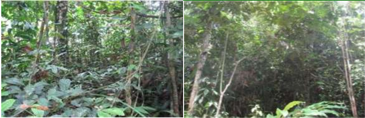
Gambar-02. Rona Plot Observasi Potensi Erosi di Konsesi Tambang Batubara di PT MMTU

Adapun lokasi dan kondisi spesifik Plot Observasi (PO) yang meliputi posisi geografis dan vegetasi untuk setiap plot dirinci pada Tabel-01 yang secara visual terinci pada Gambar-02 (PO-Terbuka, PO-2012, PO-2011, PO-2010, serta PO-Original/Hutan).