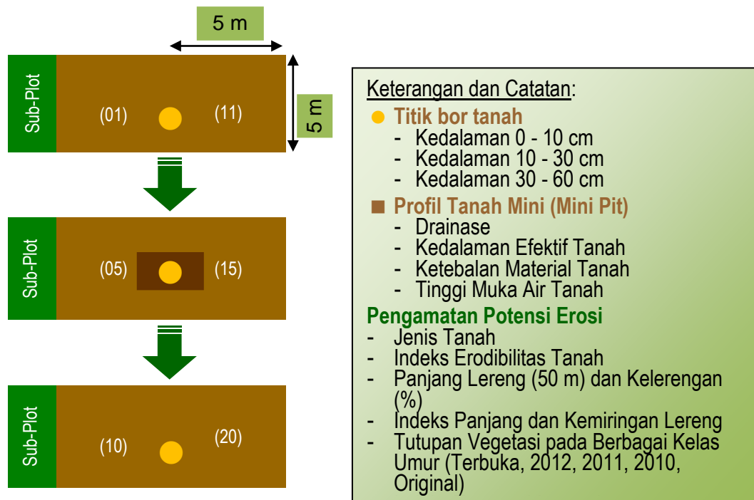
Gambar-01. Petak Observasi Potensi Erosi pada Lahan Reklamasi-Revegetasi Pasca Tambang Batubara PT MTU

Pengamatan sifat-sifat tanah dilakukan untuk mengetahui potensi tanah, baik secara kimia, morfologi maupun fisik dalam mendukung keterpulihan lahan reklamasi-revegetasi. Pengambilan sampel dilakukan dengan menggunakan bor tanah pada kedalaman 0 - 10 cm, 10 - 30 cm dan 31 - 60 cm. Pada setiap PO dibuat Profil Tanah Mini guna mengamati drainase, kedalaman efektif, ketebalan material tanah dan tinggi muka air tanah. Pengamatan potensi erosi tanah meliputi indeks erodibilitas tanah, panjang dan kemiringan lereng, tutupan vegetasi, serta ada tidaknya praktek-praktek konservasi tanah dan air.