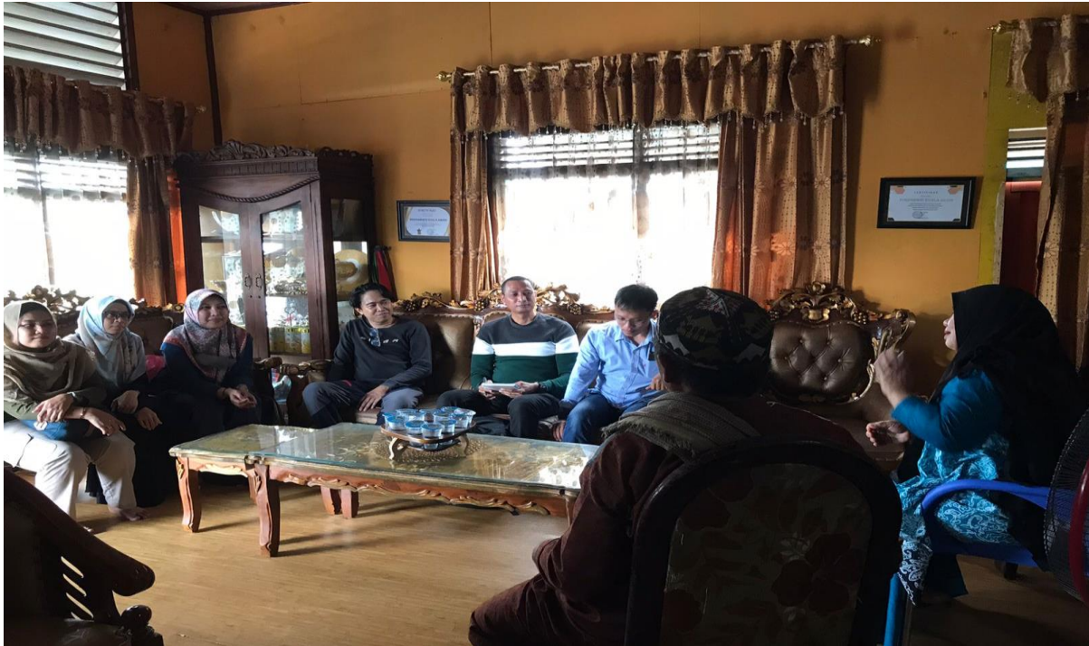
Gambar 1 Kunjungan di kediaman narasumber pendokumentasian cerita rakyat di Kelurahan Bontang Kuala