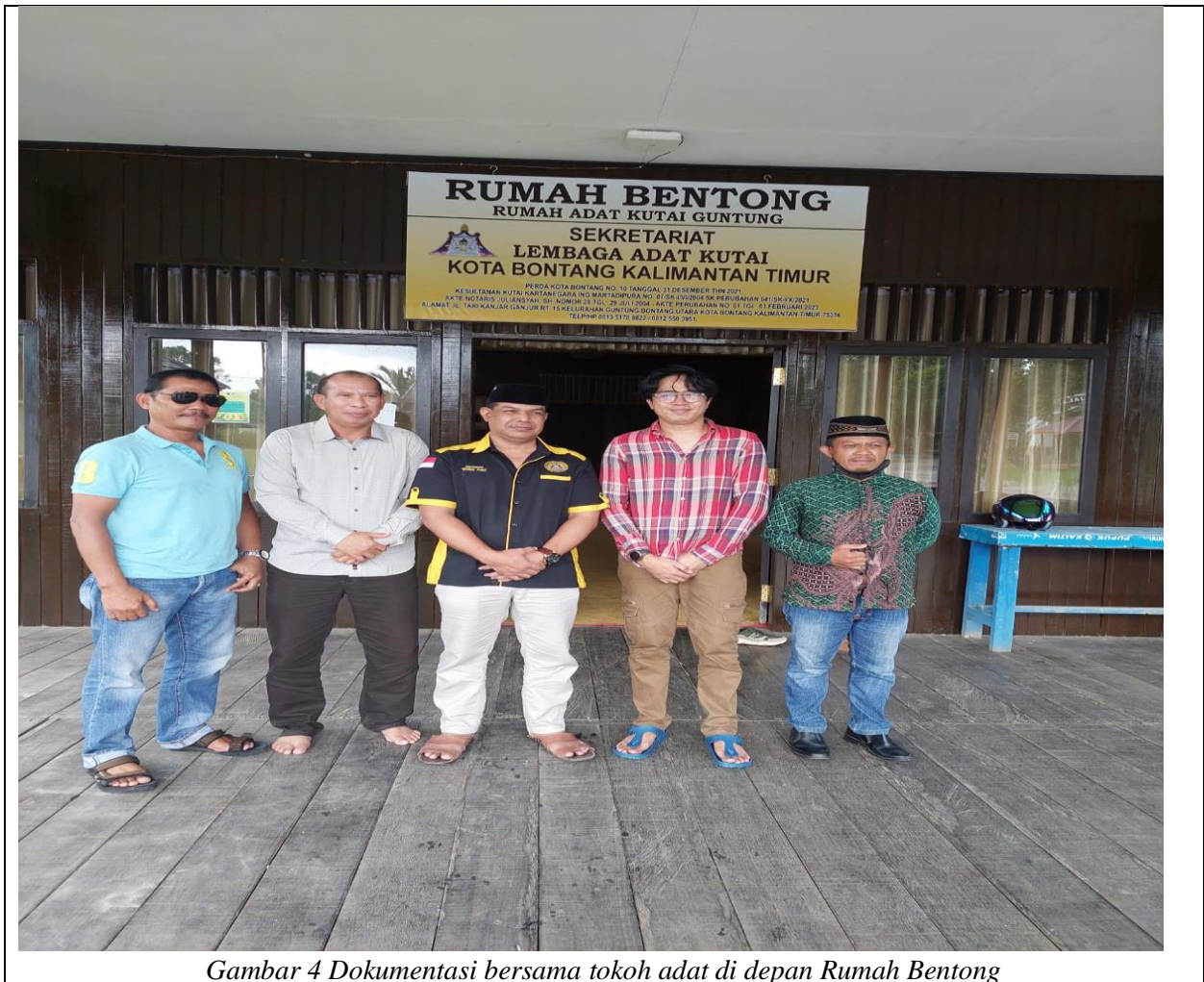
Gambar 4 Dokumentasi bersama tokoh adat di depan Rumah Bentong