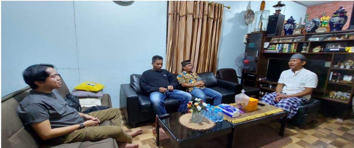
Gambar 3 Wawancara bersama narasumber di Kelurahan Guntung