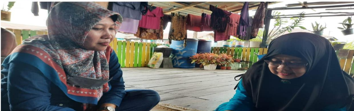
Gambar 2 Wawancara bersama narasumber di Kelurahan Bontang Kuala