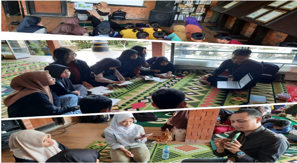
Gambar 3 Aktivitas Pembelajaran Interaktif Bahasa Inggris