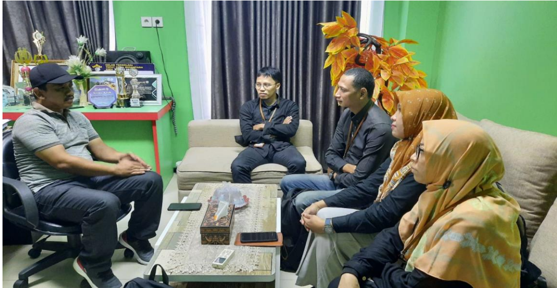
Gambar 1 Permohonan izin pelaksanaan kegiatan pengabdian masyarakat kepada Lurah Gn. Telihan, Bontang