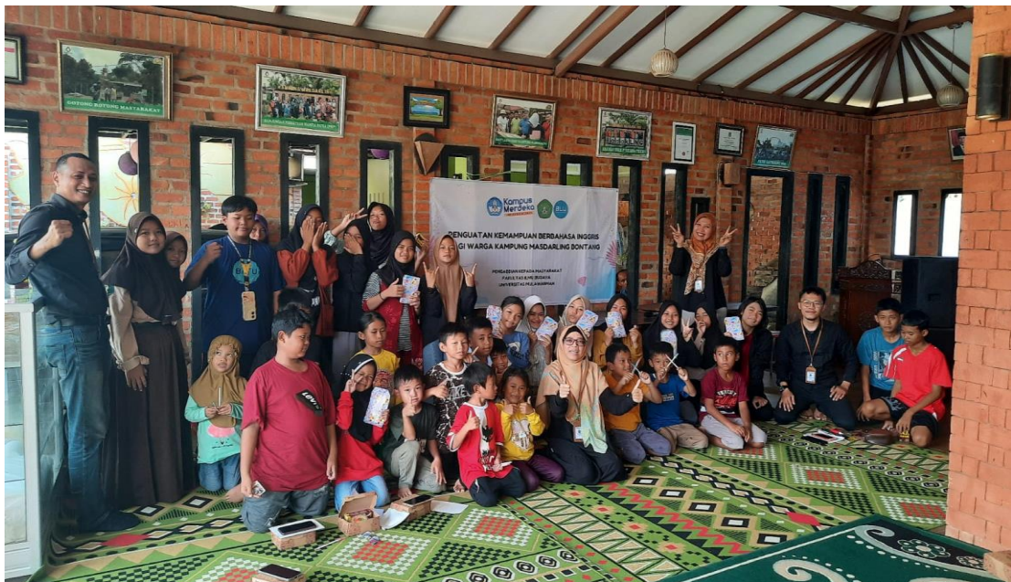
Gambar 2 Peserta Kegiatan Kelompok Belajar Bahasa Inggris Jenjang SD, SMP, dan SMA