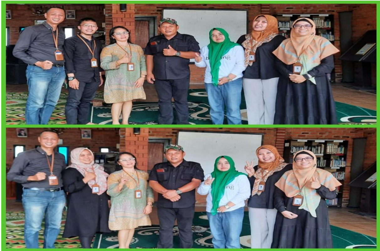
Gambar 6 Dokumentasi bersama Ketua Kelompok Kampung Masdarling