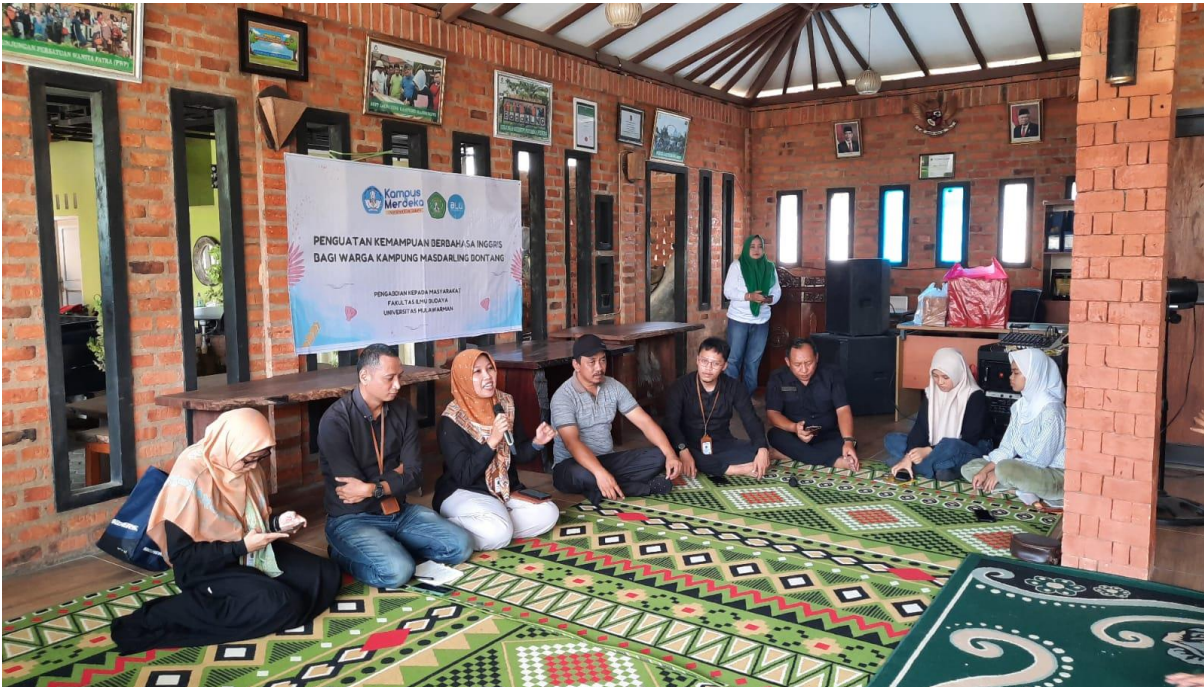
Gambar 4 Dialog Interaktif bersama Pengurus Kampung Masdarling dan Lurah Gn. Telihan