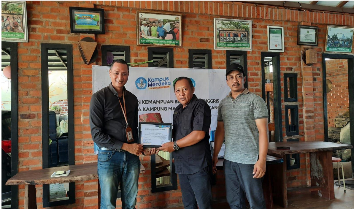
Gambar 5 Penyerahan Piagam Penghargaan