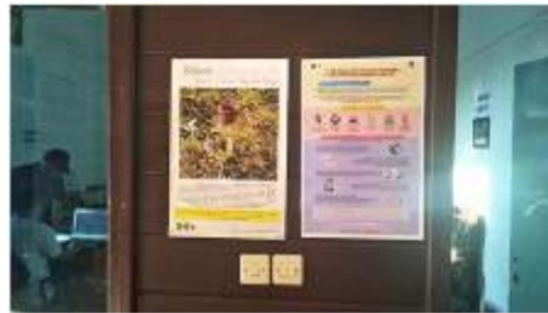
Gambar 2. Penempatan banner edukasi Covid di lokasi pengabdian Kelinjau Ulu

Langkah tersebut diambil karena perlunya mengedukasikan bagaimana cara budikdamber dengan sistem akuaponik tanpa listrik, agar dapat diterapkan oleh masyarakat Kelurahan Kelinjau Ulu dalam rangka untuk memenuhi kebutuhan pangan, ketahanan pangan dan pemenuhan gizi masyarakat Kelinjau Ulu di masa pandemi covid-19. Langkah ini dapat dikatakan berhasil karena adanya publikasi video tersebut yang mendapatkan respon yang baik dari pihak aparat desa dan jumlah penonton dan like yang cukup baik. Langkah ini juga memberikan dampak positif terhadap masyarakat dan para penonton video tersebut karena dapat mengetahui dan menerapkan budikdamber di rumah masing-masing (Gambar 3).