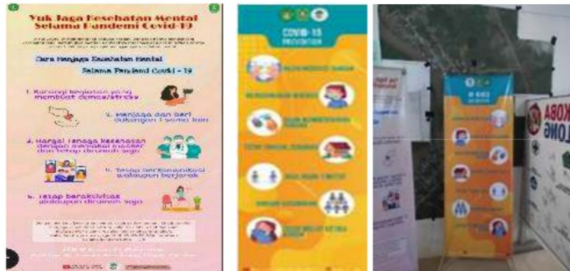
Gambar 1. Banner tentang edukasi Covid-19 di Kelinjau Ulu