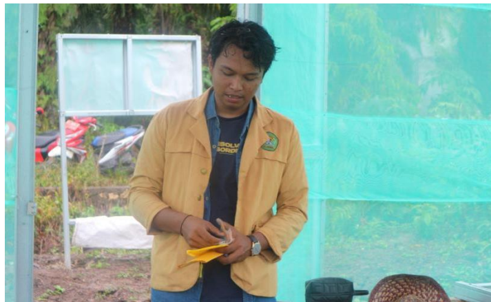
Gambar 5. Pelaksanaan Penyuluhan