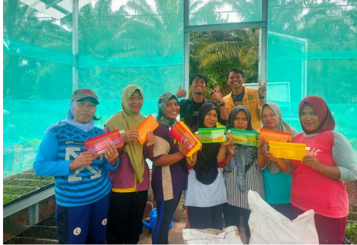
Gambar 5. Pembagian Dompot Perencanaan

Setelah melakukan penyuluhan terkait literasi perencanaan keuangan pada masyarakat Desa Sebakung Taka sebagian besar peserta penyuluhan belum memahami pentingnya perencanaan keuangan dari keseluruhan anggota KWT yang mengikuti kegiatan ini hanya 11,11% saja yang melakukan perencanaan keuangan di dalam rumah tangganya. Melihat kenyataan tersebut maka penting untuk melakukan kegiatan penyuluhan ini kepada masyarakat di Desa Sebakung Taka agar mendapatkan edukasi serta menumbuhkan kesadaran bahwa pentingnya mengelola keuangan dalam rumah tangga. Harapannya dengan melalui penyuluhan mengelola keuangan “pentingnya perencanaan keuangan” dapat memberikan kesadaran betapa pentingnya literasi keuangan.