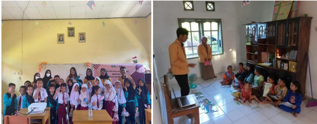
Gambar 1. Dokumentasi sosialisasi pada anak-anak usia SD

dilakukan praktek pengelolaan keuangan dan aktif menabung. Untuk meningkatkan antusiasme anak-anak, pemenang games dan kuis diberikan hadiah.