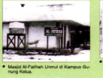
• Masjid Al-Fatihah Ummul di Kampus Gunung Kelua.