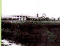
• Gedung serambi mahasiswa dan lapangan sepak bola di Kampus Gunung Kelua.