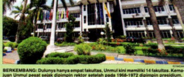
• Berkembang: Dulunya hanya empat fakultas, Ummul kini memiliki 14 fakultas. Kampus Ummul pesat sejak dipimpin rektor setelah pada 1966-1972 dipimpin presidium.