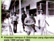
• Keadaan kampus di Sidomulyo yang digunakan pada 1966 sampai 1963.