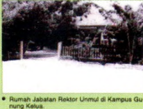
• Rumah Jabatan Rektor Ummul di Kampus Gunung Kelua.