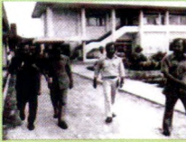
• Keadaan Kampus Ummul di Jalan P Flores pada 1979