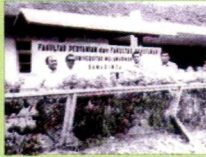
• Kampus Ummul di Jalan Blawan Sidomulyo pada 1968.