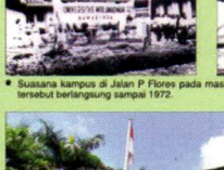
• Suasana kampus di Jalan P Flores pada masa-masa awal berdirinya Ummul. Keadaan tersebut berlangsung sampai 1972.