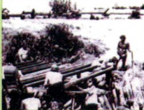
• Perbaikan jembatan oleh mahasiswa bersama warga dalam kegiatan kuliah kerja nyata (KKW).