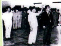
1972: UNIVERSITAS MULAWARMAN DIPIMPIN REKTOR

1970: FAKULTAS PERTAMABANGSAAN DITUTUP Sejak awal berdirinya Ummul, salah satu fakultas yang dibuka adalah Fakultas Pertambangan berdasarkan SK Menteri No 130 tanggal 17 September 1961 yang berkebutuhan di Balikpapan. Namun dalam perjalanannya, fakultas tersebut ditutup karena kesulitan koordinasi dan penyediaan sumber daya.