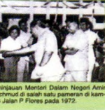
• Perkenjaan Menteri Dalam Negeri Amir Machmud di salah satu pameran di kampus Jalan P Flores pada 1972.