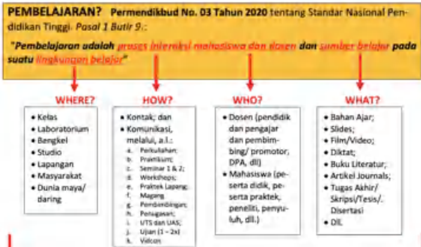
Gambar 3. Peta Pemaknaan Pembelajaran pada Pendidikan Tinggi