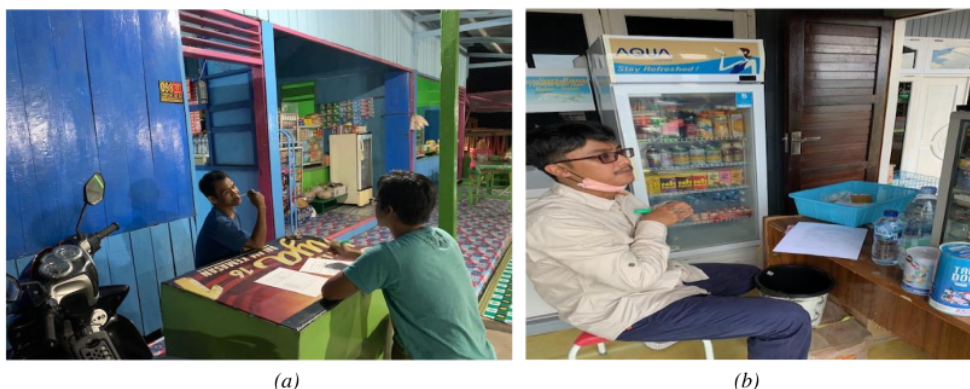
Gambar 2. Sharing dan diskusi (a) bisnis akomodasi makanan; (b) pengolahan ikan asin

Format penyelenggaraan pengabdian menggunakan teknik “door-to-door” atau secara “tatap muka”. Teknik ini mendalami dinamika dan menggali kesulitan yang dialami oleh pemilik bisnis seperti yang tampil di Gambar 2. Cakupan dalam polemik bisnis, antara lain: kualitas SDM, modal, pengalaman bisnis, omzet, upah pekerja, pangsa pasar, dan profit . Kemudian, yang berseberangan sehubungan ketujuh indikator ini disaring, diidentifikasi, dan dipetakan lewat justifikasi dari lensa akademis. Setelah mengambil pelajaran penting seputar problematika dalam operasional bisnis, lalu pelaksana PKM menyelenggarakan ceramah intens dengan meng 17 ulkan semua unit bisnis. Konsen kegiatan disalurkan kepada klaster bisnis mikro yang berlokasi di Kelurahan Bontang Kuala–Kota Bontang–Provinsi Kalimantan Timur, khususnya para pengusaha yang menjajaki bidang kuliner. Detailnya, sampel bisnis dialamatkan kepada skala rumah tangga berjumlah 35 unit yang masing-masing terbagi menjadi 2 kategori: 9 pedagang ikan asin dan 26 pedagang empek-empek, nugget , dan sosis ikan.