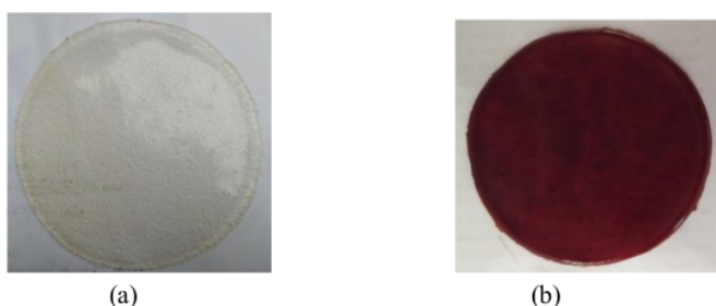
Gambar 2. (a) Edible Film Glukomanan Umbi Porang (b) Edible Film Glukomanan Umbi Porang + Ekstrak Etanol Umbi Bawang Tiwai

Glukomanan umbi Porang merupakan bahan utama dalam pembuatan edible film . Gliserol berfungsi sebagai plasticizer yang memberikan sifat ketidakakuan dan elastisitas pada edible film . Ekstrak etanol umbi Bawang Tiwai dengan konsentrasi 4% ditambahkan ke dalam EF glukomanan umbi Porang yang bertujuan untuk menambah nilai aktivitas antibakteri dari EF tersebut sehingga dapat memperpanjang umur simpan produk yang dikemas. EF sebelum dan sesudah diinkorporasi ditunjukkan pada Gambar 2.