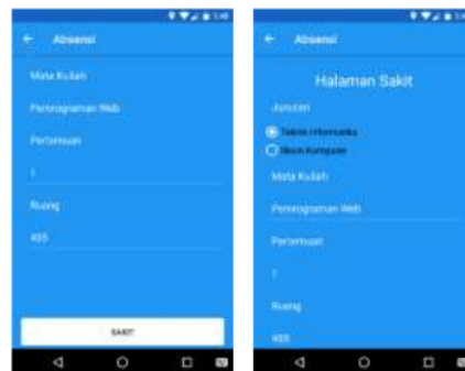
Gambar 4. Proses Sakit Mahasiswa

Pada saat mahasiswa ingin melakukan sakit, mahasiswa tersebut memilih icon sakit, kemudian memilih sesi yang telah dibuka oleh dosen lalu melakukan menekan tombol sakit