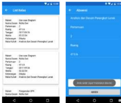
Gambar 2. Proses Absensi Mahasiswa

Pada saat mahasiswa ingin melakukan absensi mahasiswa tersebut memilih icon absen, kemudian memilih sesi yang telah dibuka oleh dosen lalu melakukan verifikasi atau cek lokasi terlebih dahulu dengan mengecek apakah mahasiswa sudah berada di ruang yang sesuai dengan sesi yang dipilih. Jika verifikasi lokasi berhasil maka mahasiswa dapat melakukan proses absensi.