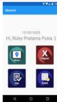
Gambar 1. Tampilan Awal Mahasiswa

Pada halaman awal mahasiswa pada aplikasi absensi perkuliahan terdiri dari 4 icon button yaitu icon absen, icon izin, icon sakit, dan icon logout.