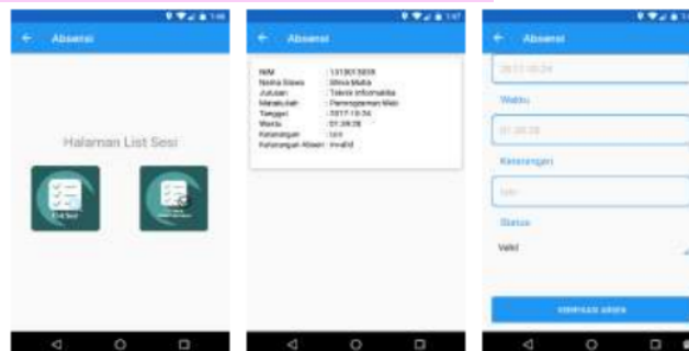
Gambar 8. Proses Verifikasi Absen Mahasiswa

Mahasiswa yang telah melakukan proses izin, dapat diverifikasi oleh dosen yang bersangkutan dengan memilih icon list absen siswa lalu memilih icon verifikasi absen siswa dan pilih list siswa yang telah melakukan izin dan ubah status mahasiswa menjadi valid. Setelah itu menekan tombol verifikasi absen.