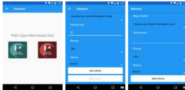
Gambar 6. Proses Buka Sesi

Pada halaman buka sesi terdapat 2 icon yaitu icon buka sesi dengan lokasi dimana dosen dapat membuka sesi dengan melakukan verifikasi atau cek lokasi terlebih dahulu dan icon buka sesi tanpa lokasi. Apabila dosen berhalangan hadir karena ada agenda yang tidak bisa ditinggal dan tetap ingin membuka sesi agar mahasiswa dapat melakukan absen.