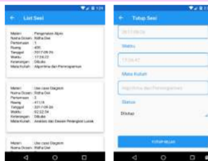
Gambar 7. Proses Tutup Sesi

Sesi yang telah dibuka dosen dapat ditutup lagi agar mahasiswa yang telat atau terlambat masuk kelas tidak dapat melakukan proses absensi dengan memilih icon list sesi lalu pilih list sesi yang telah dibuka setelah itu menekan tombol tutup kelas.