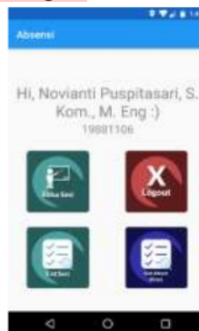
Gambar 5. Tampilan Awal Dosen

Pada tampilan Awal Dosen terdapat 4 icon button berupa icon buka sesi, icon list sesi, icon list absen siswa, dan icon logout