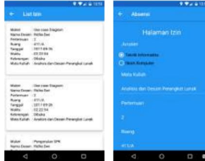
Gambar 3. Proses Izin Mahasiswa

Pada saat mahasiswa ingin melakukan izin mahasiswa tersebut memilih icon izin, kemudian memilih sesi yang telah dibuka oleh dosen lalu menekan tombol izin, setelah itu menunggu verifikasi absen dari dosen yang terlibat.