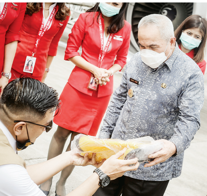
Gubernur menerima barang untuk penanganan COVID-19 di Provinsi Kalimantan Timur. Nilainya Rp 9,5 miliar. Dari dana Biaya Tak Terduga (BTT). Diabadikan Harian Disway Kaltim (17/12) Pagi.

Kemarin, Kaltim mencatat tambahan kasus cukup banyak: 235. Tambahan terbesar dari Bontang sebanyak, 67 kasus, kemudian Samarinda, 42 kasus, disusul Balikpapan, 38 kasus. Dengan tambahan itu, maka total kasus mencapai 23.376 orang, 19.758 sembuh, 2.960 menjalani perawatan dan 658 meninggal dunia.