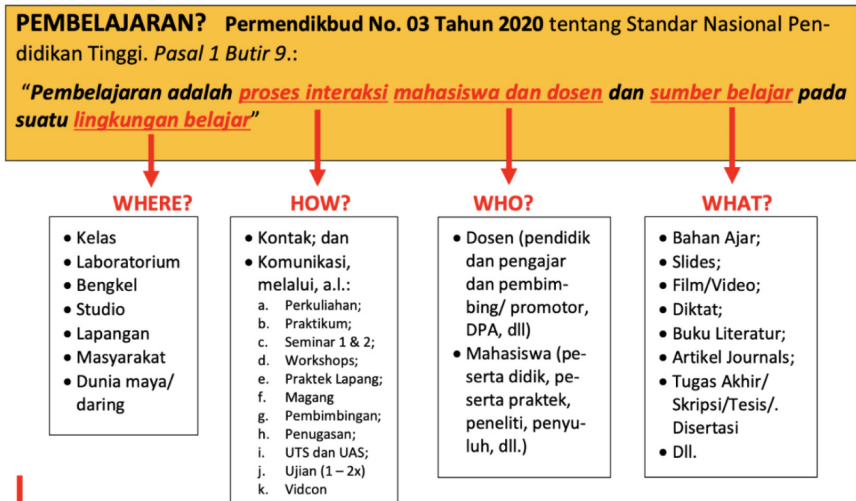
Gambar 3. Peta Pemaknaan Pembelajaran pada Pendidikan Tinggi