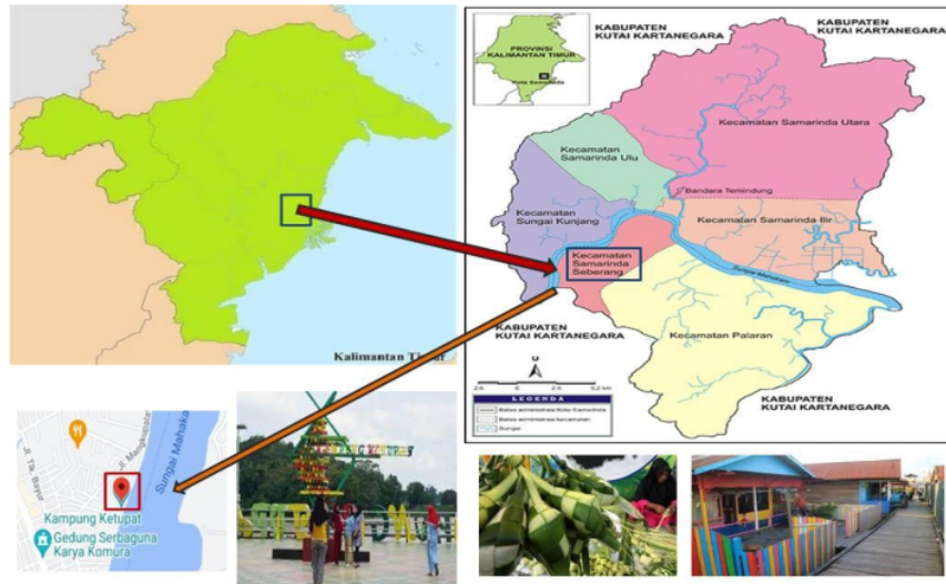
Gambar 2. Area PKM

Pendekatan dipetakan dengan tatap muka dan luring ini tentu saja dengan mematuhi dan memperhatikan protokol kesehatan yang disesuaikan dengan regulasi