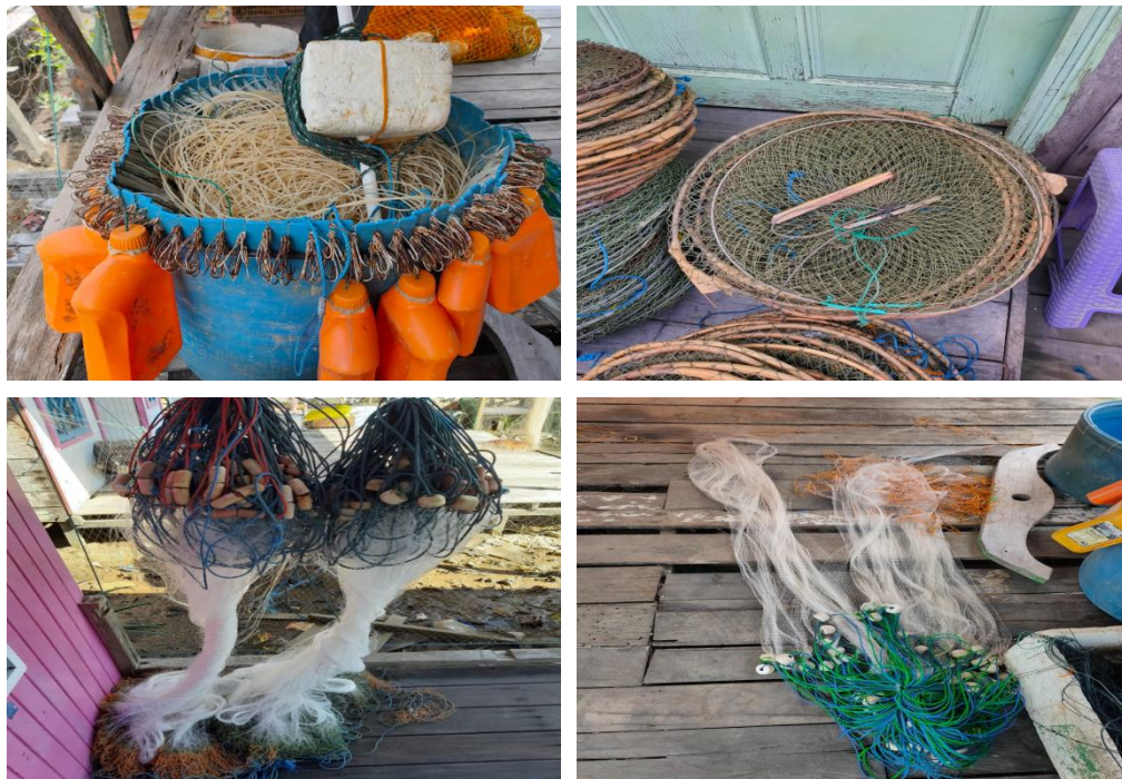
Gambar 4. Jenis Alat Tangkap yang digunakan oleh Nelayan di Desa Muara Pantuan

Kegiatan penangkapan ikan di Desa Muara Pantuan, masih tergolong tradisional. Aktivitas penangkapan dilakukan menjelang sore sampai keesokan harinya, atau dengan kata lain aktivitas penangkapan yang dilakukan oleh nelayan masih bersifat one day fishing . Meskipun ada beberapa nelayan yang melakukan kegiatan penangkapan dengan cara bermalam 3-5 hari dilaut. Rata-rata jumlah hari melaut adalah 6 hari dalam satu minggu. Pada hari jumat sebagian besar nelayan di wilayah ini tidak melakukan aktivitas penangkapan, karena pada hari tersebut, nelayan memfokuskan diri untuk melakukan ibadah sholat jumat. Beberapa alat tangkap yang digunakan oleh nelayan di wilayah ini diantaranya alat tangkap pancing, Rakkang, rawai dan jaring.