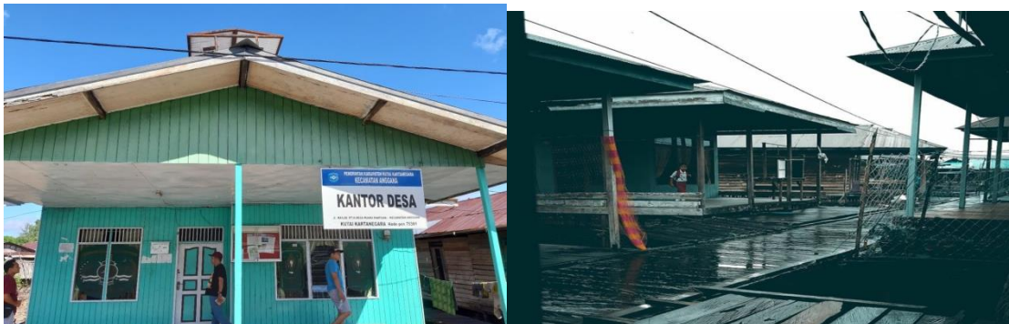
Gambar 2. Kantor Desa Muara Pantuan dan Wilayah Pemukiman Masyarakat di Desa Muara Pantuan

Desa Muara Pantuan merupakan satu diantara kecamatan yang ada di Kecamatan Anggana, Kabupaten Kutai Kartanegara, Provinsi Kalimantan Timur dan memiliki wilayah seluas 51.332 Ha. luas wilayah konservasi darat adalah 28.027 Ha dan luas wilayah konservasi perairan/laut adalah 13.851 Ha. Sedangkan wilayah pemukiman penduduk hanya seluas 119 Ha. (Musfaring, et al , 2018).