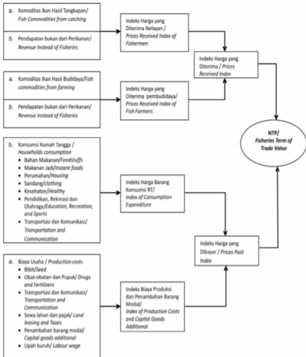
Gambar 1. Alur Perhitungan Indeks Nilai Tukar Perikanan (Sumber : Armen, et al , 2011)

penambahan barang modal, serta upah buruh. Alur pikir perhitungan NTP nelayan dan pembudidaya ikan dapat dipelajari dari Gambar 1.