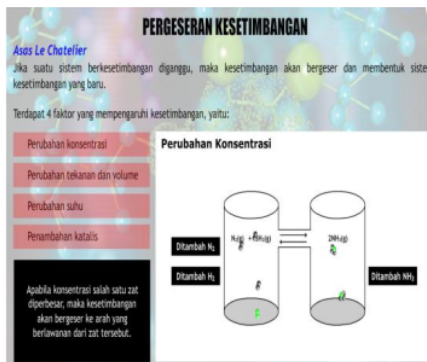
Gambar 4. Revisi memperjelas level mikroskopis

Pada sub pergeseran kesetimbangan mengalami revisi yang banyak agar memperjelas level submikroskopis/ mikroskopis pada tampilan (Gambar 3). Setelah mengalami revisi dapat dengan jelas melihat perubahan yang terjadi pada aspek pergeseran kesetimbangan ditinjau dari level representasi submikroskopis/ mikroskopis (Gambar 4).