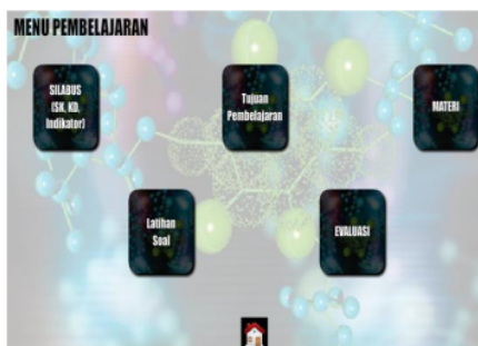
Gambar 1. Rancangan awal susunan menu

Pada rancangan awal menu berupa kotak-kotak tersebar seperti pada gambar 1. Setelah mendapat masukan maka menu berubah seperti pada gambar 2.