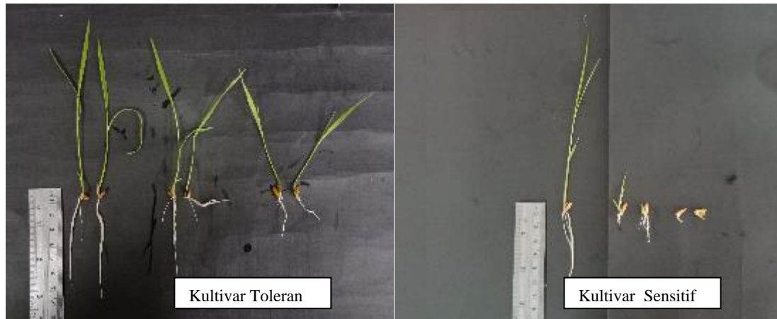
Gambar 1. Kultivar yang termasuk kategori toleran pada Mekongga dan sensitif pada IR64

Hasil analisis ragam menunjukkan bahwa kultivar tanaman padi lokal asal Kalimantan Timur yang digunakan memberikan pengaruh yang nyata. Sedangkan konsentrasi cekaman Al yang diberikan berpengaruh tidak nyata pada masing-masing kultivar padi, demikian pula interaksi keduanya berpengaruh tidak nyata terhadap bobot basah akar tanaman. Berdasarkan pengujian lanjutan terhadap pengaruh kultivar padi lokal asal Kalimantan Timur pada berbagai konsentrasi AlCl_3 terhadap bobot basah akar yang dihasilkan dengan uji BNJ 5% (Tabel 2) terlihat bahwa respon kultivar IR64 ( V_1 ) berbeda nyata terhadap kultivar Ketan Putih ( V_{20} ), Ketan Putek Iting ( V_{23} ), Pulut Mayang ( V_{24} ) dan Pulut Linjuang ( V_{25} ). Sedangkan kultivar Ketan Putek Iting ( V_{23} ) berbeda nyata dengan semua kultivar yang diamati. Ketan Putek Iting memiliki bobot basah akar tertinggi, sedangkan IR64 memiliki bobot basah akar terendah.