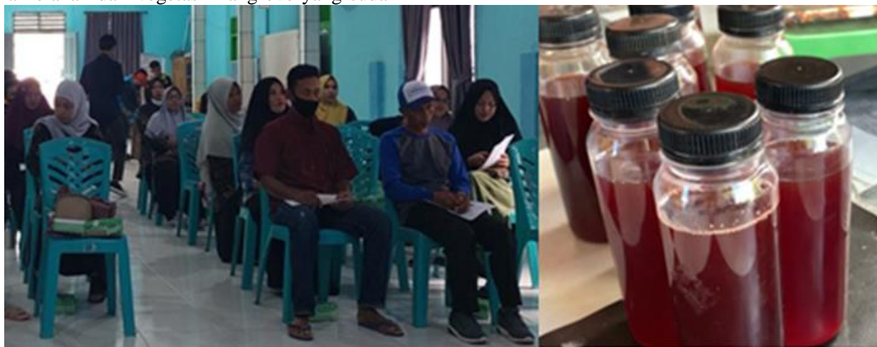
Gambar 2. Peserta menyimak uraian manfaat buah mangrove sebagai bahan makanan/minuman

dikemas yang disajikan menggunakan slide-slide yang telah dirancang, disajikan juga demo cara pengolahannya.