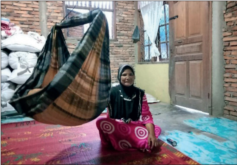
Gambar 2.1 Kegiatan mengayun anak etnis Mandailing di Desa Pargarutan