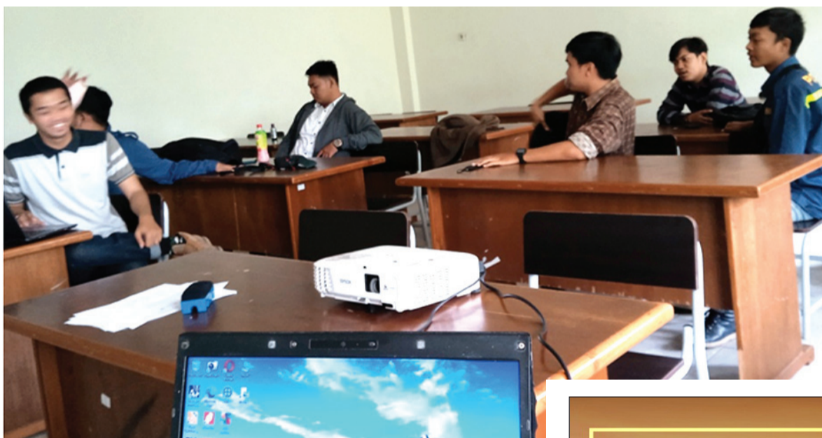
pengabdian kepada masyarakat ini sendiri didanai