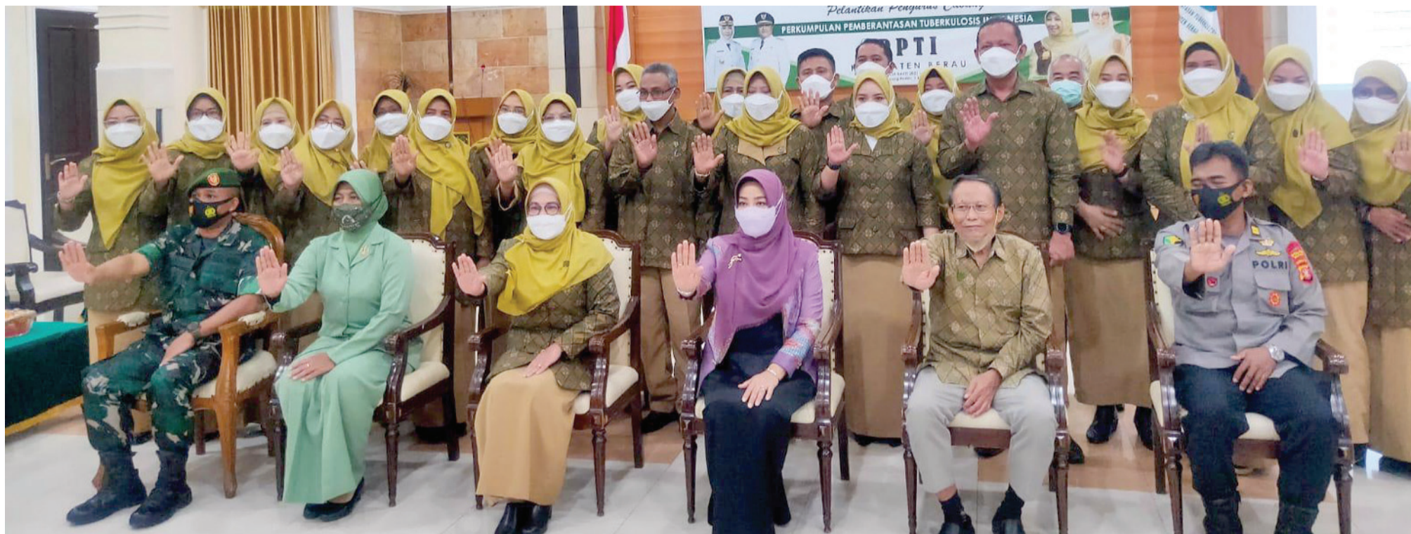
Foto bersama usai pelantikan PPTI cegah Tuberkulosis di Bumi Batiwakkal.