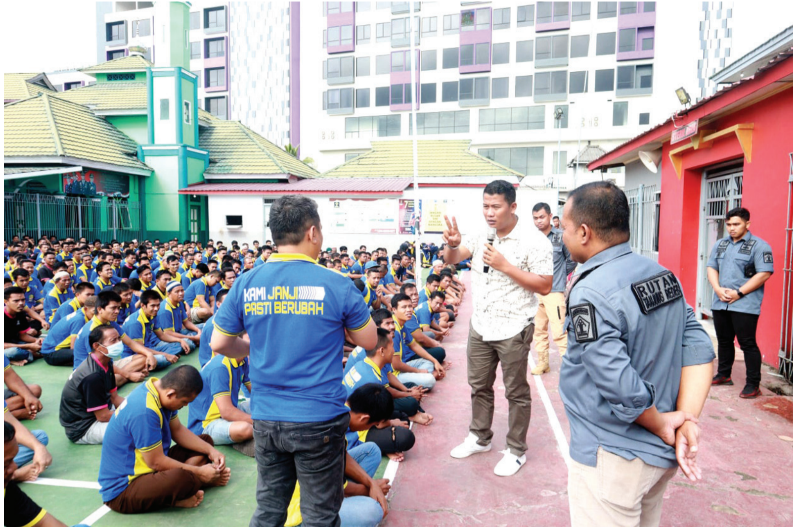
Suasana saat Rutan sosialisasikan SE DitjenPAS nomor PAS-12.H.H.01.02 tahun 2022 ke WBP.

Adapun peraturan yang diberlakukan tambahannya, yaitu pihak keluarga dan pihak WBP sudah harus melaksanakan vaksinasi Covid-19 hingga tahap ke 3 atau vaksin booster. Semua itu untuk mengetahui status vaksinasi masyarakat