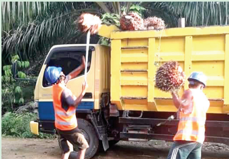
Sumber penghasilan utama yang mendongkrak Pendapatan Asli Kampung (PAK) Sumber Agung Kecamatan Batu Putih yakni Kelapa Sawit.

Dalam mengelola perkebunan sawit saja tambahnya, tenaga kerjanya merupakan warga kam-