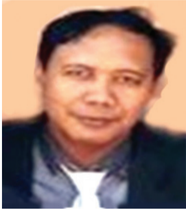
Oleh: Unu Nurahman

Dalam penyusunan program yang berdampak kepada murid, seorang pemimpin pembelajaran harus mampu bersinergi atau berkolaborasi dengan semua pihak yang ada di sekolah baik dewan guru, staf tata usaha, siswa, orang