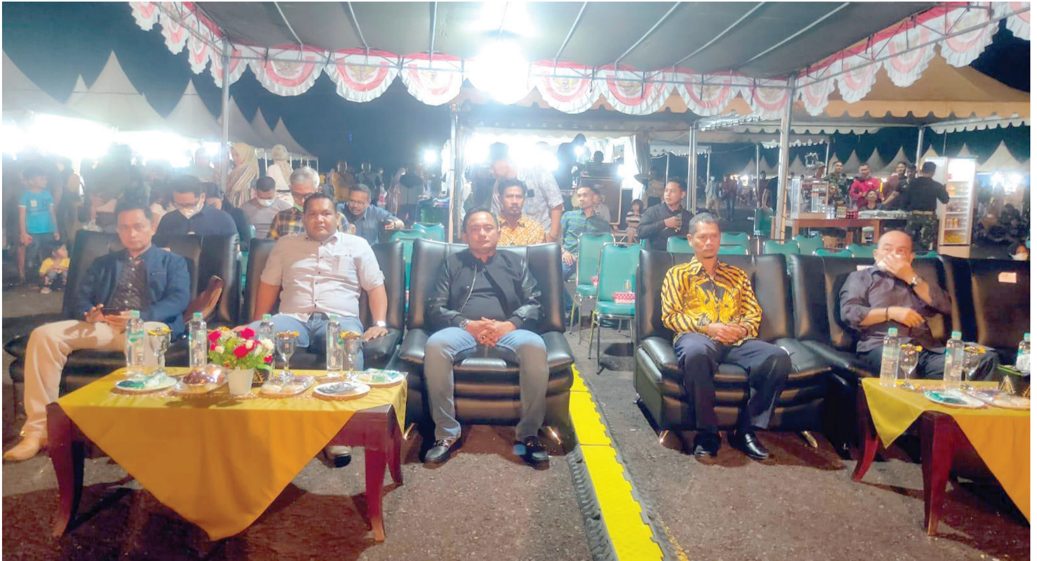
Pembukaan Serbu Exhibition 2022.