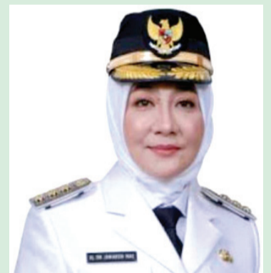
Sri Juniarsih Mas Bupati Kabupaten Berau

"Kedepan harapan saya tidak hanya Sumber Agung, tetapi kampung-kampung lain juga berbenah diri, sehingga seluruh kampung memiliki standar yang sama dalam pelayanan administrasi, pembangunan infrastruktur hingga pemberdayaan masyarakat termasuk meningkatkan Sumber Daya Manusia (SDM)," ujar Petinggi di Bumi Batiwakkal itu. Lanjut Beliau, SDM disini maksudnya lebih banyak diberikan pelatihan dan itu semakin menambah wawasan para aparat-aparat di kampung. Agar seluruh kampung di Berau menjadi kampung yang maju dan mandiri yang seluruh masyarakatnya sejahtera. Dan tidak kalah pentingnya mampu memiliki