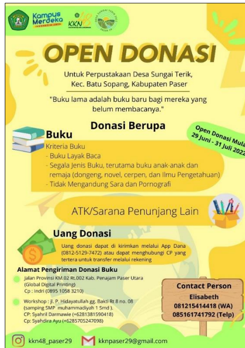
Gambar 3. Persiapan fasilitas perpustakaan Desa Sungai Terik. (A) pengadaan barang berupa pemindai kode batang ( barcode scanner ) melalui platform belanja daring; (B) desain pamflet yang digunakan untuk menjaring donasi buku atau material dari masyarakat Samarinda, Tanah Grogot dan sekitarnya.