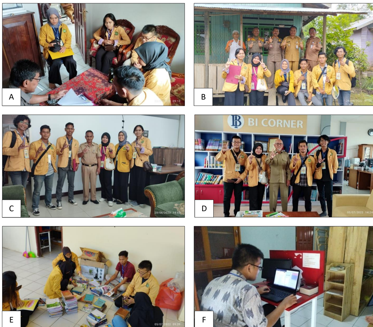
Gambar 2. Tahap persiapan dan pengumpulan data untuk dalam membangun sistem perpustakaan. (A) berkoordinasi dengan Kepala Desa Sungai Terik dalam menentukan rumusan masalah; (B) mengkomunikasikan rencana partisipasi lomba perpustakaan nasional dan rencana pembangunan perpustakaan dengan Kepala Kecamatan Batu Sopang sebagai bagian yang mengetahui proposal yang telah disusun; (C) memohon surat rekomendasi ke Dinas Pendidikan Kabupaten Paser sebagai pendamping proposal; (D) berkoordinasi dengan pihak Dinas Perpustakaan Daerah Kabupaten Paser untuk pengajuan donasi buku untuk perpustakaan Desa Sungai Terik; (E) bekerja sama untuk melakukan pendataan dan pelabelan buku; (F) melakukan persiapan sistem perpustakaan yang terkomputerisasi.

faktual ( application following interpretation ). Dengan kata lain, membaca dapat diartikan mengerti terhadap informasi yang dihadirkan secara visual, serta menginterpretasikan dan mengaplikasikan informasi tersebut.