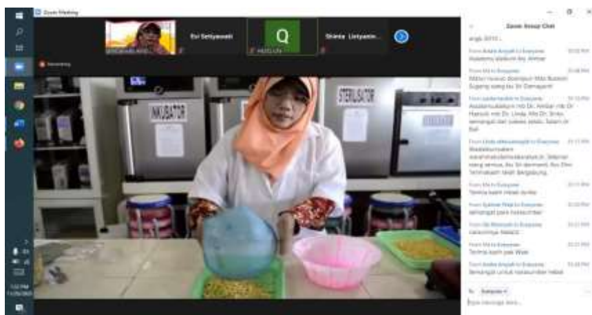
Gambar 1. Proses Pembuatan Tempe