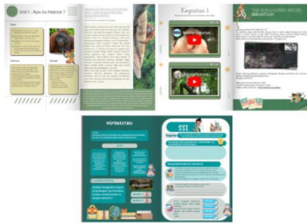
Gambar 2. Isi Materi dan kegiatan Pembelajaran berbasis STEM-SSI

video pembelajaran dimasukkan dengan menyertakan ID Video.