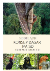
Gambar 1. Sampul Awal

Aplikasi Canva digunakan untuk membuat sampul e-modul. Pertama, penulis memilih desain template terbaik. Selanjutnya peneliti mengunggah gambar yang akan dijadikan sebagai background cover. Setelah itu, peneliti menyesuaikan posisi gambar dan menambahkan filter dan edit teks. Langkah terakhir adalah menyimpan hasil desain.