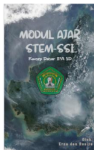
Gambar 3. Cover belakang e-modul

Sampul belakang e-modul dibangun dengan bantuan Canva dengan menggabungkan berbagai gambar dan bentuk serta identitas penulis, yang kemudian dialokasikan ke Canva dan disertai penambahan dengan elemen lain dari e-modul.