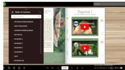
Gambar 6. Tampilan Penambahan komponen halaman e-modul

Penambahan halaman juga menjadi aspek yang disoroti oleh ahli materi, sehingga pada tahap akhir dari modul, ditambahkan halaman untuk mempermudah pembaca dari modul berbasis STEM-SSI, sejalan menurut Rahdiyanta (2016) nomor halaman ada, sebaiknya juga memuat daftar isi disertakan dalam desain modul. Hal ini dilakukan untuk memudahkan mahasiswa menemukan topik, serta memudahkan mahasiswa dalam mencari halaman yang diinginkan.