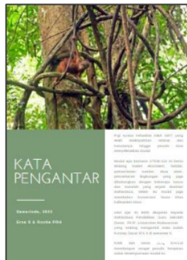
Gambar 5. Tampilan Penambahan komponen Kata Pengantar

Kata pengantar juga merupakan komponen modul yang ditemukan belum lengkap pada draf awal modul. Kata pengantar modul berfungsi sebagai landasan konseptual untuk analisis, perencanaan, pengembangan, pelaksanaan, dan penilaian, oleh karena itu kata pengantar merupakan anatomi penting yang harus dimasukkan dalam modul. (Pohan, 2014). Sehingga pada draf akhir modul ditambahkan kata pengantar yang memperjelas tentang gambaran umum modul pada pembaca.