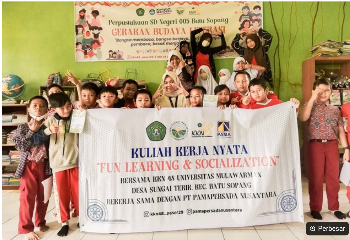
Salah satu program kuliah kerja nyata mahasiswa Universitas Mulawarman yaitu "Fun Learning and Socialization" di Desa Sunga Terik, Kecamatan Batu Sopang, Kabupaten Paser, Kalimantan Timur.

Tajuk pemindahan ibukota negara dari Jakarta menuju Nusantara di Kalimantan Timur semakin sering dibahas semenjak Presiden Joko Widodo mengumumkan rencana tersebut secara resmi pada tanggal 26 Agustus 2019. Selanjutnya beberapa peraturan yang terkait dengan ibu kota negara (IKN) Nusantara sudah diterbitkan seperti UU Nomor 3 Tahun 2022, PP Nomor 17 Tahun 2022, Perpres Nomor 62,