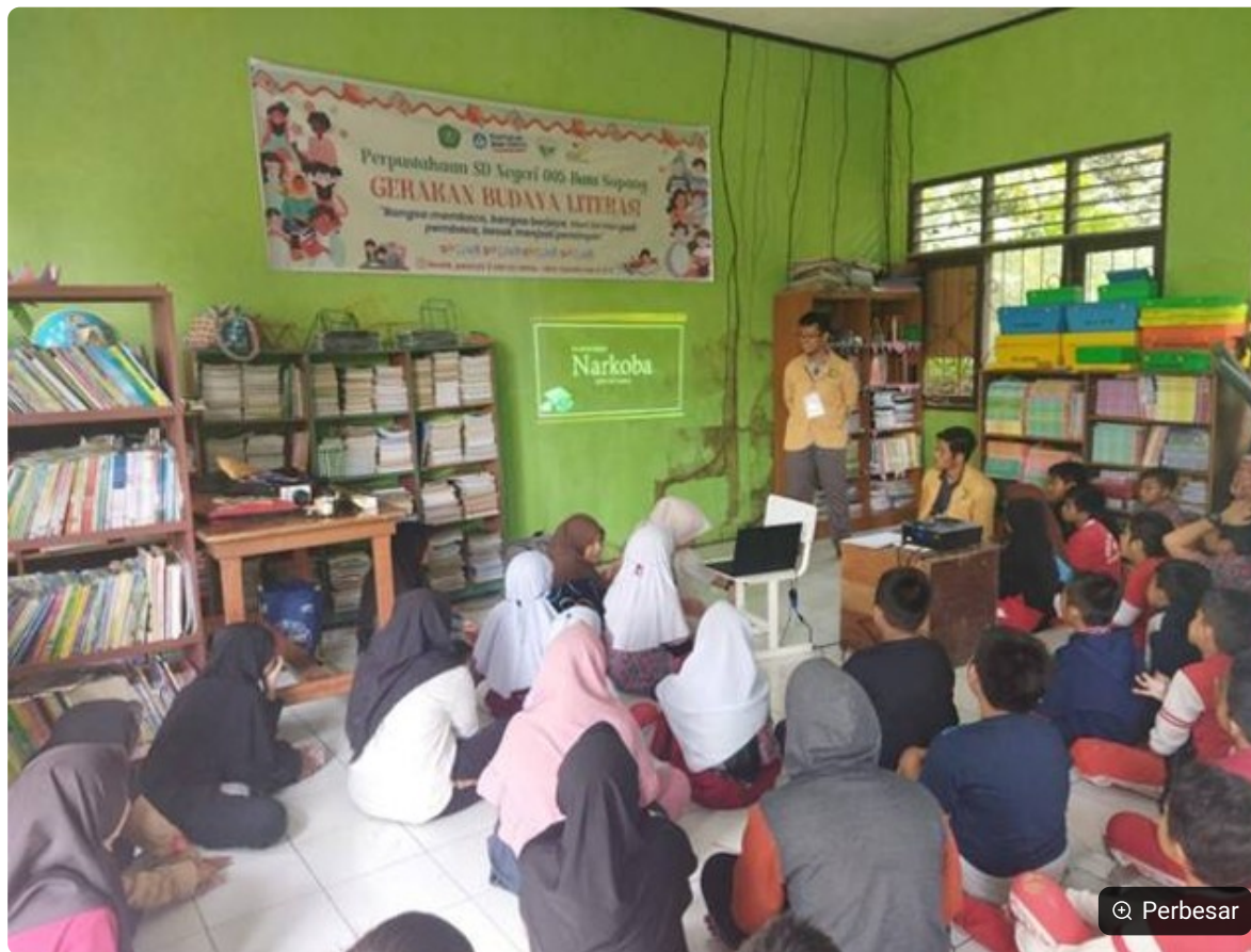
Kegiatan sosialisasi pencegahan peredaran dan penggunaan narkoba di SDN 05 Batu Sopang, Kabupaten Paser, Kalimantan Timur.

penduatan website desa, pendidikan etika dan moral, sosialisasi terkait peningkatan budaya literasi dan pencegahan narkoba, edukasi penggunaan bahasa asing sebagai persiapan persaingan di era globalisasi serta pendampingan UMKM untuk menjadi desa agrowisata.