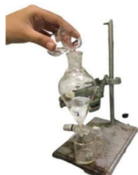
Gambar 1 Rangkaian pemasangan tabung kolom

Selanjutnya ditimbang berat silika gel sekam padi dan sintesis sebagai berat awal silika gel. Kemudian masukkan silika gel ke dalam tabung kolom. Lalu masukkan air sebanyak 50 ml kedalam tabung kolom. Amati proses penyerapan silika gel selama 10 menit. Setelah itu timbang silika gel yang sudah