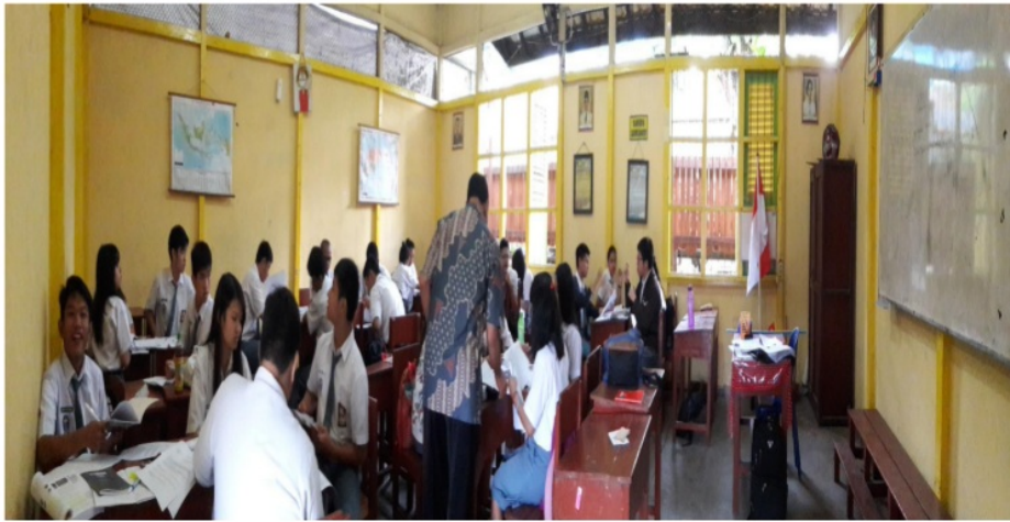
Gambar 1 Peneliti sebagai model