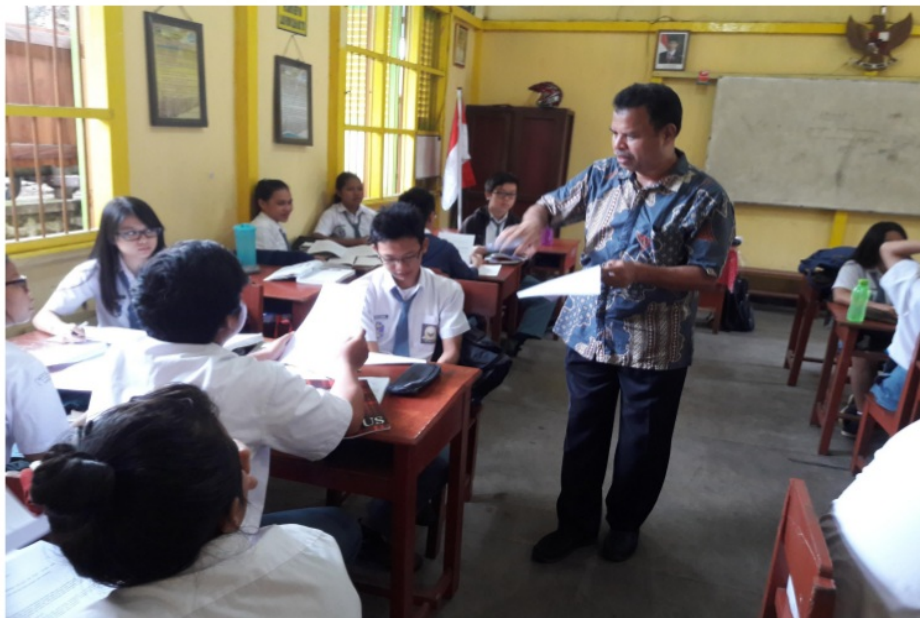
Gambar 4 Peneliti sebagai model