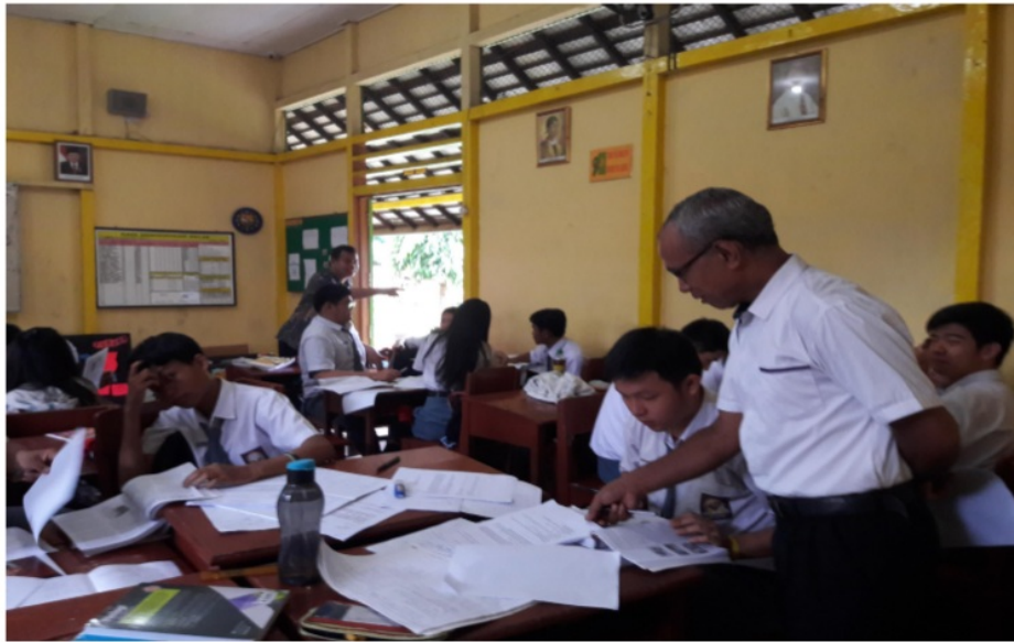
Gambar 5 Guru biologi sebagai pengelola pembelajaran