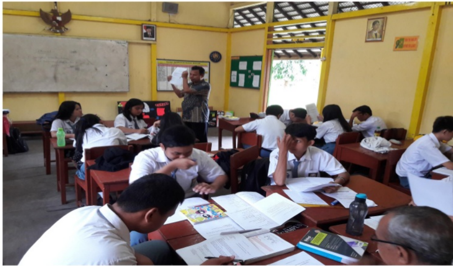
Gambar 3 Peneliti sebagai model