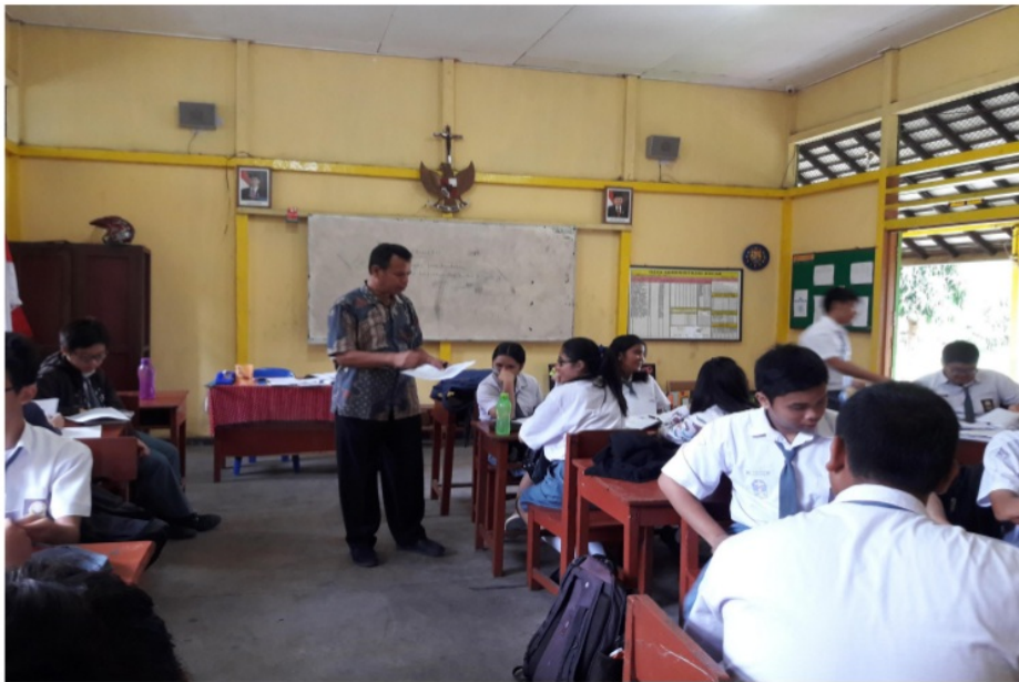
Gambar 2 Peneliti sebagai model