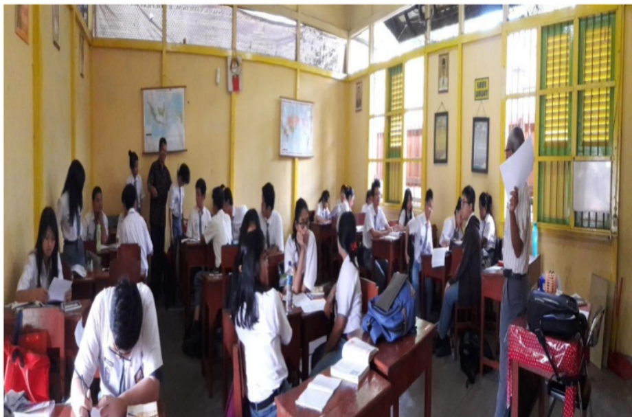
Gambar 10 Guru biologi membimbing diskusi kelompok, peneliti sebagai observer