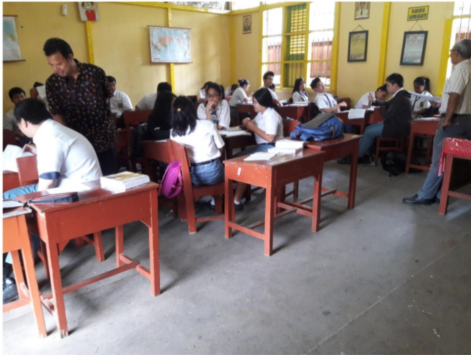
Gambar 9 Guru biologi mengelola pembelajaran, peneliti sebagai observer