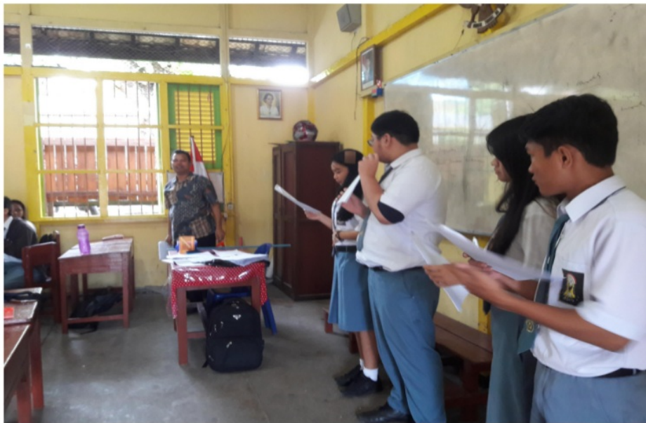
Gambar 6 Siswa mempresentasikan hasil pembahasannya