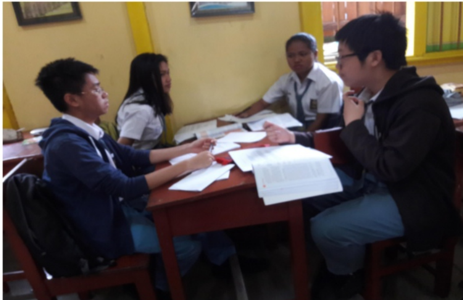
Gambar 7 Suasana dikusi kelompok