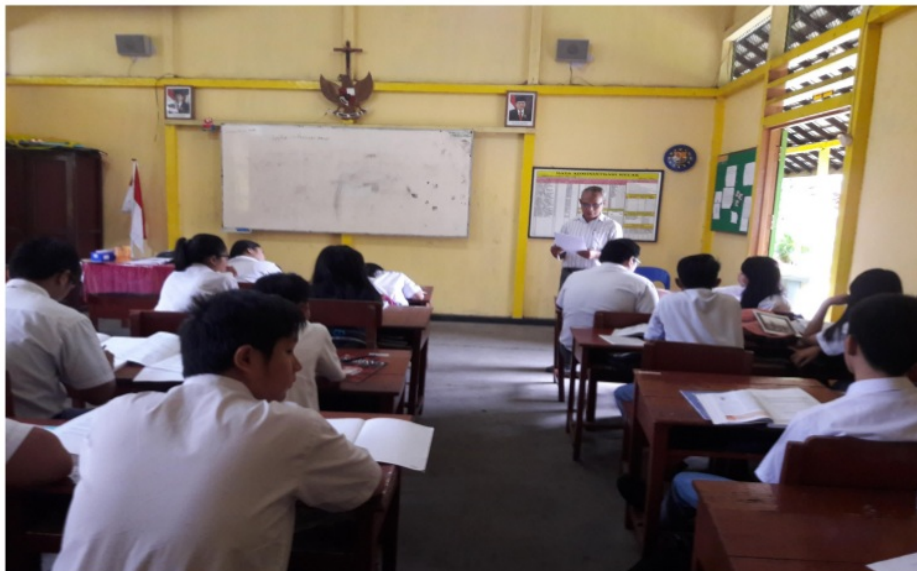
Gambar 8 Guru biologi memulai pembelajaran dengan menerapkan PBL dipadu CS