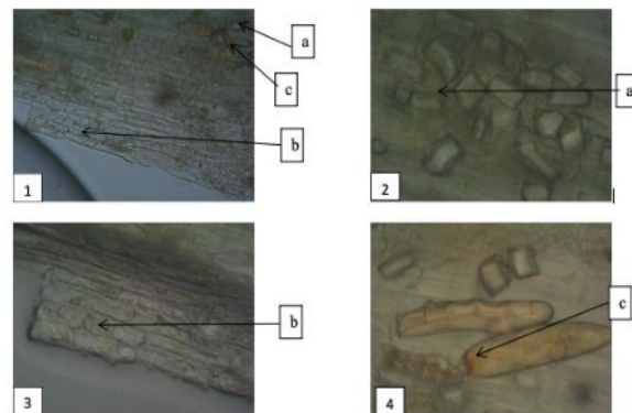
Gambar 1. (1)Perbesaran 40x (2)\Perbesaran 100x (3) Perbesaran 100x (4) Perbesaran 100x. Daun tahongai segar (a) sel gabus tidak beraturan (b) sel gabus beraturan (c) butir pati

sel dari jaringan gabus atau felem . Sel ini berbentuk lempeng, tersusun rapat dan dindingnya mengandung suberin (zat gabus). Berdasarkan hasil pengamatan diketahui sel gabus berbentuk segiempat. Pengamatan pada Gambar 4. terlihat butir pati (amilum). Amilum atau pati adalah salah satu metabolit yang secara kimia merupakan senyawa karbohidrat yang kompleks (polimer) dan pada sel berupa butiran. Secara mikroskopis butiran amilum atau pati dari jenis tumbuhan tertentu berbentuk khas sehingga dapat dijadikan sebagai identitas tumbuhan tersebut. Berdasarkan hasil pengamatan diketahui butir pati berbentuk lonjong, sebagian besar tunggal, ada yang bergerombol dua atau tiga, hilus terlihat berupa garis.