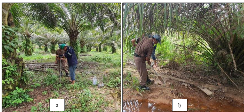
Gambar 2. Pengumpulan sampel tanah di lokasi tanah kering (a) dan lokasi tanah rendah (b)

Konsen Tatapapan berikutnya melakukan pengambilan sampel tanah secara campuran dari 4 titik lokasi. Pada area datar yang kering, diambil 3 titik. Sementara itu, khusus area datar rendah an berair hanya diambil 1 titik. Gambar 2 merepresetasikan pemungutan sampel tanah di 2 lokasi berbeda yakni lahan kering dan randahan berair.