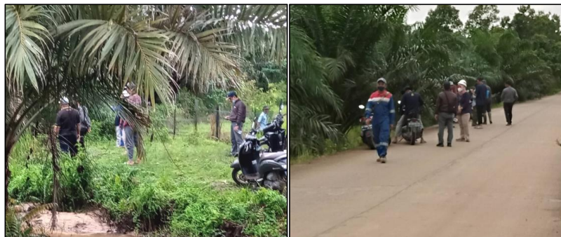
(a) Gambaran dan konsisi TBS

didesain untuk menggabungkan atau penyesuaian pemahaman dan mereduksi persilangan pendapatan mengenai kriteria pembatas tanah yang ideal, karena selama ini kurang tepat.