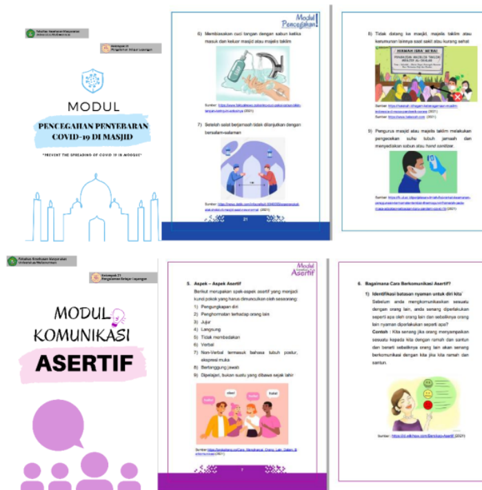
Gambar 4. Kegiatan pelatihan dan Modul pelatihan bagi “Pa’Jaga Masiji”

Program kedua yaitu “Pa’Jaga Masiji” bekerjasama dan memberdayakan Ikatan Remaja Mesjid (Irma) Masjid untuk menjadi agen promosi kesehatan. Remaja dipilih dengan kriteria usia 16-18 tahun dan bersedia bergabung dan menjalankan kegiatan. Remaja diberikan pelatihan untuk meningkatkan pengetahuan tentang pencegahan Covid-19 serta komunikasi asertif yang dilengkapi modul/ booklet.