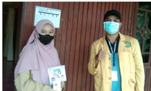
Gambar 3. Kegiatan Penempelan stiker Centang “BISSA” dan edukasi di rumah warga

17 Selanjutnya diberikan sabun cuci tangan pada setiap tempat cuci tangan di depan rumah yang diharapkan dapat mendorong masyarakat menggunakannya secara optimal dari sebelumnya. Langkah selanjutnya adalah penempelan stiker berisi daily activity masyarakat dalam melaksanakan protokol kesehatan yang digunakan sebagai media pengingat pada warga. Stiker Centang “Bissa” diletakkan pada bagian depan rumah sedangkan disekitar fasilitas cuci tangan ditempelkan stiker langkah cuci tangan yang baik dan benar atas persetujuan warga. Saat kegiatan penempelan media dilaksanakan pula praktik bersama dengan pemilik rumah terkait langkah cuci tangan. Berikut adalah hasil kegiatan pengabdian masyarakat yang dilakukan ada program Centang “Bissa”.