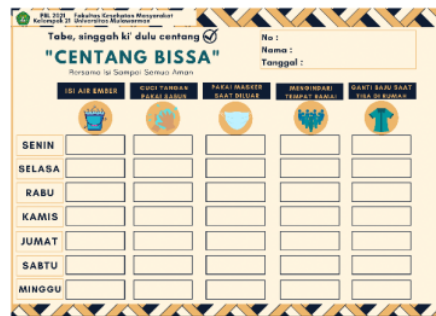
Gambar 2. Media Stiker Centang "Bissa"

Pelaksanaan pengabdian dilaksanakan pada masa PPKM sehingga dilaksanakan dengan mengikuti protokol kesehatan yang ketat. Kegiatan pada program pertama yaitu Centang “Bissa”. Masyarakat diedukasi mengenai penjelasan bagaimana kebiasaan mencuci tangan memiliki pengaruh terhadap penularan Covid-19.