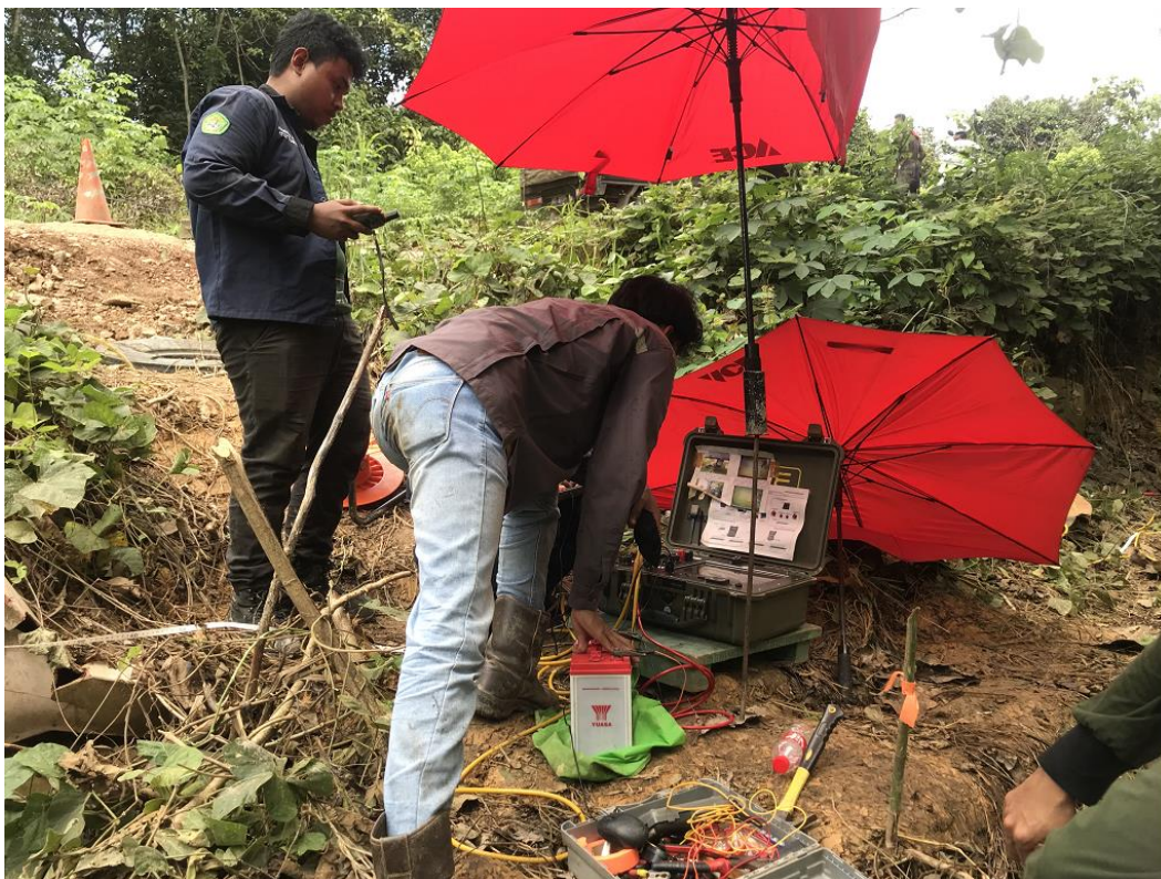
Foto pengukuran data geolistrik