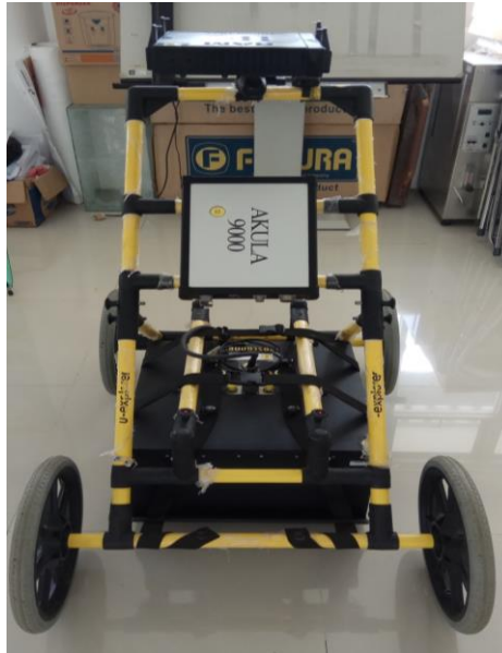
Gambar 3 Peralatan Metode GPR

Selain peralatan di atas juga dilengkapi dengan peralatan lainnya seperti meteran, GPS, kompas dan peta.