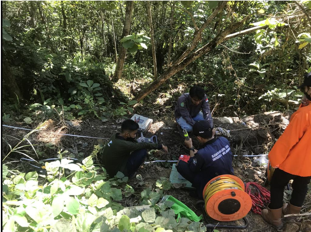
Foto tim di lokasi II