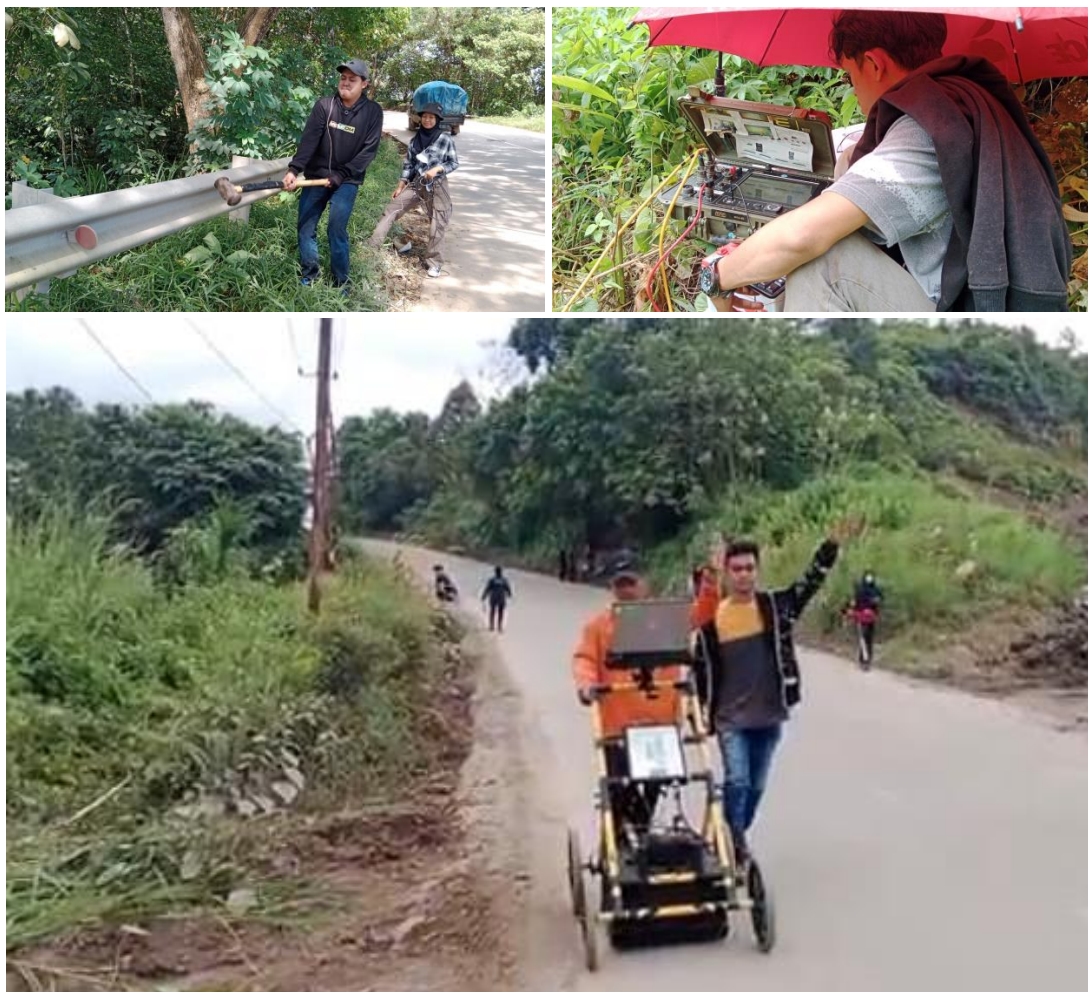
Gambar 5 Pengukuran menggunakan metode seismik dan GPR

Pada lokasi pertama, pengukuran seismik dilakukan pada 2 lintasan yaitu di kiri dan kanan jalan. Namun, karena ada masalah pada alat (aki habis) dan kabel penjepit salah satu geophone terlindas kendaraan umum yang lewat sehingga pengukuran hanya dilakukan pada satu lintasan saja. Sedangkan untuk metode GPR, pengukuran berjalan lancar sehingga tim pengabdian berhasil mendapatkan data dari beberapa lintasan.