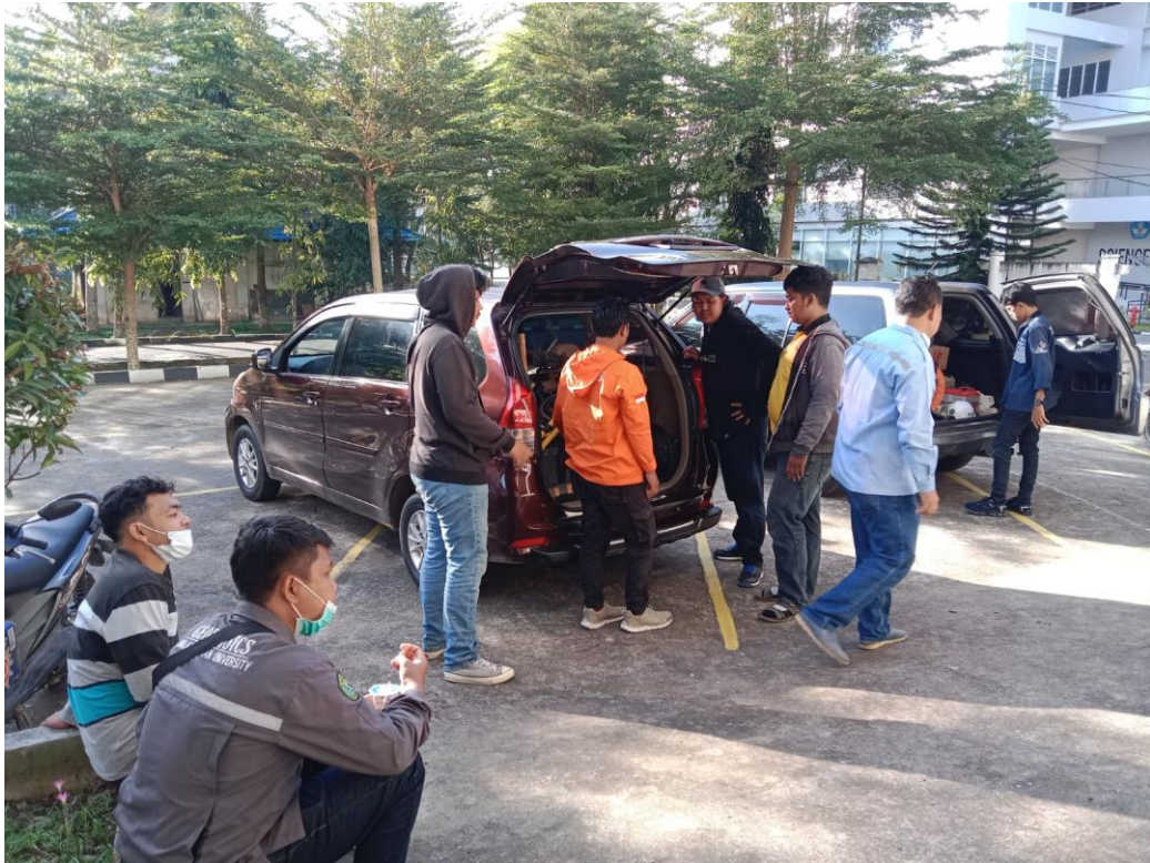
Foto ketika tim memasukkan peralatan ke mobil