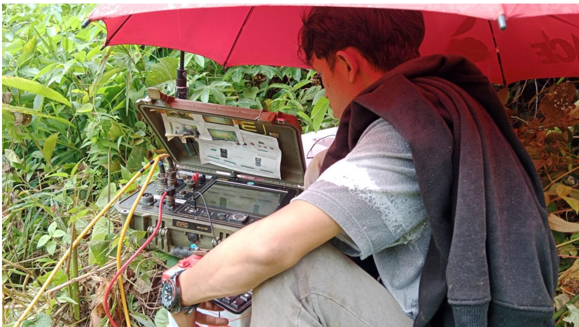
Foto pengukuran data seismik