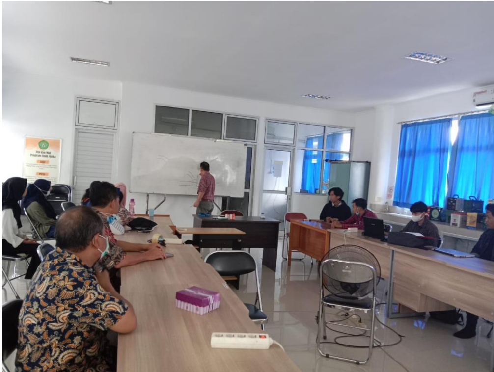
Foto rapat koordinasi tim yang akan berangkat ke lapangan