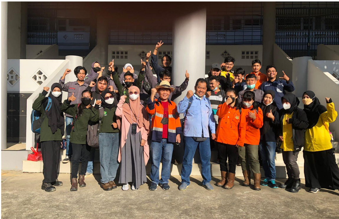
Foto bersama tim yang akan berangkat ke lapangan