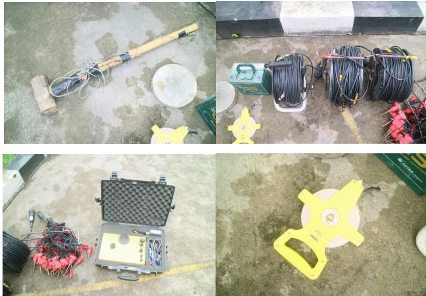
Gambar 1 Peralatan Metode Seismik