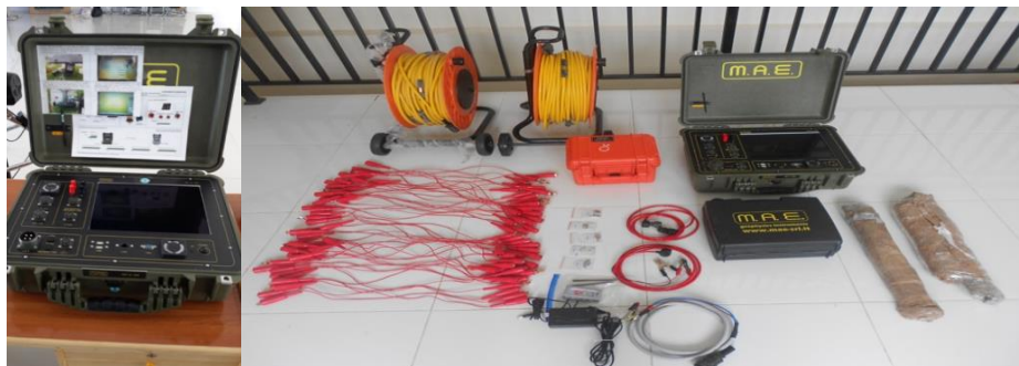
Gambar 2 Peralatan Metode Geolistrik

MAE-unit X612-EM, 48 elektroda, kabel dan power supply . Peralatan ini digunakan dalam pengukuran geolistrik dimana arus listrik yang bersumber dari aki atau baterai sebagai sumber arus DC diinjeksikan melalui elektroda ke dalam permukaan bumi sehingga dihasilkan variasi beda potensial. Arus listrik dan variasi beda potensial akan mengakibatkan variasi tahanan jenis semu.