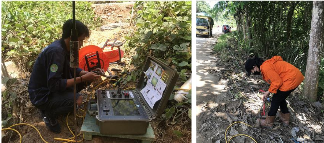
Gambar 6 Pengukuran Menggunakan Metode Geolistrik

Pada lokasi ke dua, pengukuran geolistrik dilakukan pada tiga lintasan yaitu pada kiri dan kanan jalan serta di bagian bawah jalan. Pengukuran geolistrik juga berjalan tanpa kendala yang berarti.