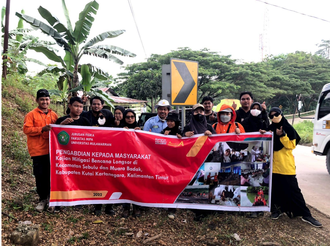
Foto tim di lokasi I