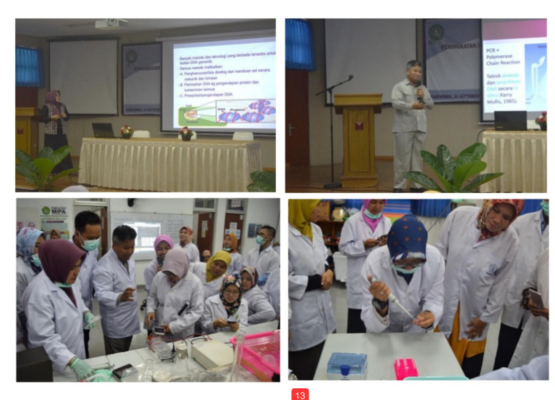
Gambar 1. Kegiatan pelatihan biologi molekuler bagi Guru-guru SMA dari kota Samarinda dan Tenggarong (Atas: Teori di kelas; Bawah: Praktek di laboratorium)