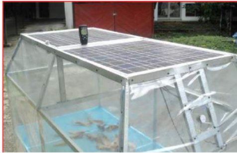
Gambar.1 Skema atap kolektor aktif dengan terintegrasi PV/T

Kegiatan rancang-bangun sistem pengering dan pengawet hasil produk pertanian menggunakan bahan dasar yang mudah diperoleh dipasaran, diantaranya: rangka terbuat dari bahan alumunium yang ditutup dengan bahan plastik (polyethylene) yang diintegrasikan dengan dua modul fotovoltaik (PV/T), dan kipas angin DC. Skema prototipe sistem GHD yang akan diujicobakan menggunakan skema atap kolektor aktif ( active collector-roof ) ditunjukkan pada Gambar 1.