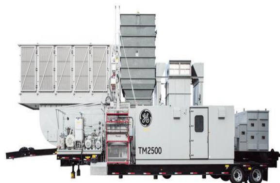
Gambar 1. Mobile Power Plant

Kontrak kerjasama ini diresmikan tahun 2016 dan ditargetkan rampung tahun 2020. Namun hingga lewat periode kerjasama yang disepakati selama lima tahun pihak Iran masih belum merealisasikan komitmen dalam kerjasama tersebut karena ada beberapa hambatan baik secara internal dan eksternal.