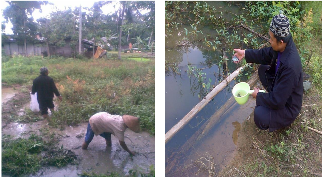
Gambar 1. Kegiatan Perbaikan Ekologi perindukan/ Breeding Places Vektor Malaria dan pelepasan ikan nila pada potensi survival jentik anopheles

Kegiatan perbaikan ekologi ini dilakukan di lima titik lokasi yang berpotensi menjadi breeding places di RT 23 yaitu di kolam yang tidak dirawat, lagun dan persawahan sekitar penduduk. Kegiatan ini menggunakan ikan nila ( Oreochromis niloticus ) dan udang air tawar ( Cambarus virilis ) yang merupakan musuh alami stadium pra dewasa vektor malaria. Dalam kegiatan ini partisipasi masyarakat terlihat antusias, hal ini menunjukkan masyarakat memiliki kesadaran yang cukup baik untuk melakukan perbaikan kondidi ekologis lingkungan agar tidak menjadi breeding places vektor Malaria, akan tetapi mereka memerlukan dorongan dan motivasi seperti pada kegiatan ini. Penggunaan ikan nila sebagai predator alami selain bermanfaat untuk pengendalian vektor stadium pra dewasa juga dapat menjadi tambahan asupan protein masyarakat karena ikan yang sudah besar nanti dapat dikonsumsi oleh masyarakat.