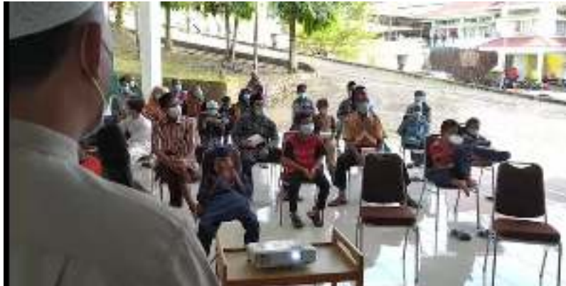
Gambar 2 : Foto Kegiatan edukasi : Penyuluhan Pencegahan Infeksi Saluran Kemih