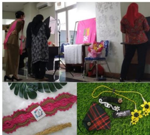
Gambar 3. Proses Pengambilan Gambar Hasil Foto Produk Peserta

Hasil dari diadakannya workshop ini, peserta perajin menambah pengetahuan pentingnya peningkatan dan pengembangan mutu produk, serta pengetahuan agar menjadi pengusaha yang baik dan dapat dipercaya. Berdasarkan pengamatan selama kegiatan berlangsung. Antusiasme peserta ditunjukkan dengan hasil-hasil foto produk yang diambil oleh peserta yang telah sesuai dengan contoh yang sebelumnya diberikan dan pemahaman peserta yang telah meningkat akan pemikiran pengusaha. Proses pengambilan gambar produk dan hasil foto produk oleh peserta dapat dilihat pada Gambar 3 berikut.