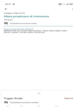
1 Gambar 2.3 Kegiatan Inti

Berdasarkan gambar 2.2 dapat diketahui bahwa guru mempersilahkan siswa untuk mengisi absen melalui google classroom dan langsung direspon oleh siswa dengan mengisi absen tersebut sebelum pelajaran dimulai, meskipun ada dari siswa yang tidak mengisi absen tanpa adanya keterangan. Di kegiatan, guru memberikan materi tentang masa praaksara di Indonesia dengan menggunakan google classroom berupa teks atau foto dari buku pelajaran dan materi berupa video, kemudian siswa menyimak dan menyimpulkan dari apa yang siswa tangkap dari video tersebut.