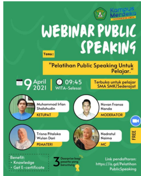
Gambar 1. Pamflet