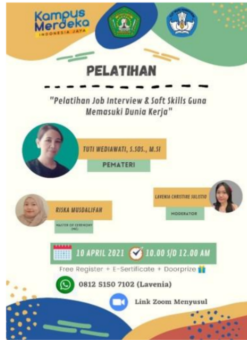
Gambar 1. Pamflet Kegiatan

Kegiatan Pelatihan ini dilaksanakan pada Hari Sabtu tanggal 10 April 2021, pelaksanaan kegiatan ini berlangsung dari pukul 10.00-12.00 WITA. Sebelum acara dimulai, panitia memberikan Google Form (Pra Test) untuk mengisi sebagai daftar hadir sekaligus melihat seberapa pengetahuan peserta tentang job interview dan sebelum menutup acara panitia memberikan Google Form ( Pre Test ) untuk melihat seberapa jauh pemahaman peserta setelah mengikuti kegiatan ini dari awal sampai akhir.