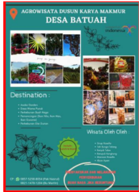
Gambar 6. Brosur Dusun Karya Makmur

Potensinya adalah perkebunan buah lai dan buah naga, kolam pemancingan ikan mas, nila dan gurame, Dasa wisata Pucuk dan Asoka Garden. Sedangkan hasil olahan dari kelompok dasa wisata Pucuk yang bisa menjadi buah tangan antara lain sirup Rosella, teh bunga telang, keripik talas, kerupuk kangkung, manisan rosella dan abon ayam