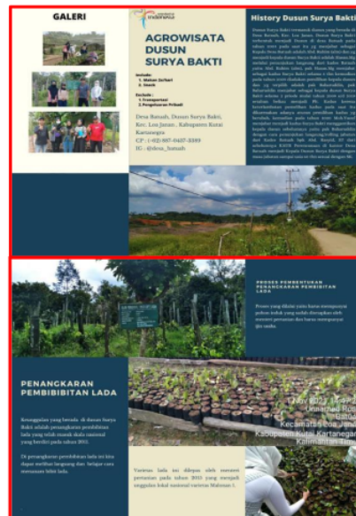
Gambar 12. Brosur Dusun Surya Bakti

Potensi yang bisa diangkat dari dusun ini adalah penangkaran pembibitan lada (sahang/merica)