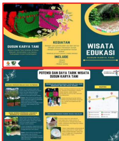
Gambar 11. Brosur Dusun Karya Tani

Potensi dan daya tarik wisata Dusun Karya Tani antara lain kolam pemancingan dan outbound . Sedangkan wisata edukasi yang bisa diangkat dari Dasa Wisma Kembang Jakarta sebagai wisata edukasi antara lain budidaya tanaman kunyit aktivitas yang bisa dilakukan yakni proses belajar menanam kunyit dan mengolah kunyit menjadi olahan pangan. Kemudian belajar membuat kerajinan tangan berupa tas dari tali kur. Selain itu kita juga bisa melihat proses panen madu kelulut.