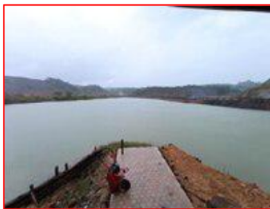
Gambar 1. Danau Ex Tambang di desa batuah

Danau ex tambang adalah lubang yang terbentuk karena pengeboman batu bara oleh Perusahaan batu bara di daerah Desa Batuah sehingga menjadi danau yang sangat menawan dengan warnanya jernih hijau kebiru-biruan membuat Danau Ex Tambang ini terlihat menarik dan layak dijadikan Wisata Tirta.