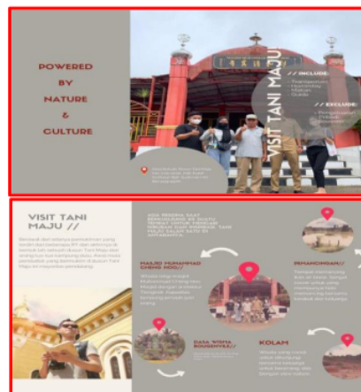
Gambar 5. Brosur Dusun Tani Maju

Potensi daya tarik yang ada antara lain Kolam, Pemancingan, Mesjid ChengHoo, Dasa Wisma Bougenville