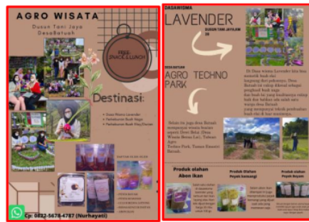
Gambar 8. Brosur Dusun Tani Jaya

Potensinya adalah perkebunan buah lai dan buah naga, sedangkan dasa wisata yang ada yakni dasa wisata lavender dengan hasil olahan pangan yang bisa jadi buah tangan antara lain, peyek bayam, peyek kemangi, lulur bedda lotong, beras kencur instan dan abon ikan.