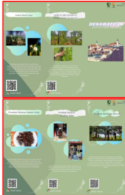
Gambar 10. Brosur Dusun Tani Bahagia