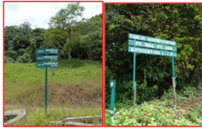
Gambar 2. Papan nama Tabuan Agro Techno Park

perusahaan yang masih aktif dan akses akan di buka pada 2 atau 3 tahun mendatang pada saat aktivitas tambang sudah berhenti.