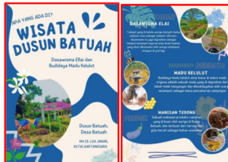
Gambar 9. Brosur Dusun Batuah

Potensi yang bisa diangkat dari dusun ini adalah Dasa Wisata Elai dengan hasil produk olahan andalannya adalah manisan terong dan daya tarik lainnya adalah budidaya madu kelulut.