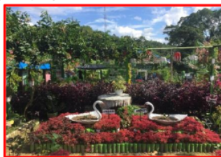
Gambar 3. Salah Satu Taman Dasawisma

Dasawisma adalah program PKK yang dibentuk untuk membangun kedekatan antara ibu-ibu rumah tangga dibagi ke dalam kelompok yang terdiri dari 10 KK, tugasnya adalah bercocok tanam, sambil berkebun sehingga hasilnya dapat dimanfaatkan untuk kebutuhan rumah tangga atau diproduksi menjadi sebuah produk yang bisa dijual sehingga menghasilkan pendapatan. Adapun tanaman yang ditanam di taman dasawisma ini adalah sayur-sayuran (bayam, sawi, kangkung, pare, terong, timun, dll) toga (tanaman obat keluarga seperti jahe, kunyit, kencur, serai, rosella, temulawak, dll) bumbu-bumbu (cabai, bawang prai, seledri, kemangi, tomat, lengkuas, dll)