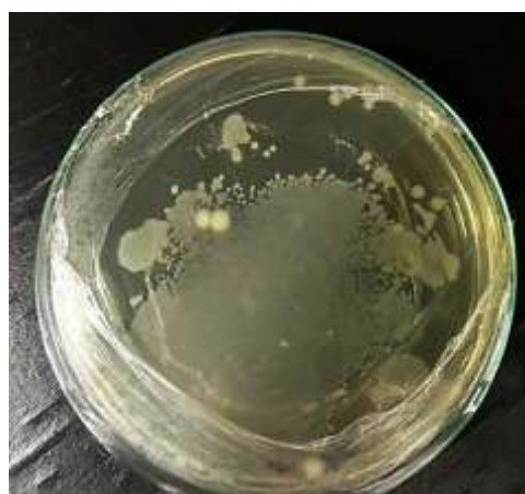
Gambar 2. Hasil pemurnian bakteri endofit.

Pemurnian bakteri endofit dilakukan untuk memperoleh koloni bakteri tunggal dengan melakukan pengenceran bertingkat sebanyak 1000 kali dengan menggunakan metode cawan tebar pada media nutrient agar (NA). Hasil diperoleh merupakan koloni-koloni yang terpisah-pisah. Koloni tunggal yang diperoleh sebanyak 5 koloni seperti pada Gambar 2.