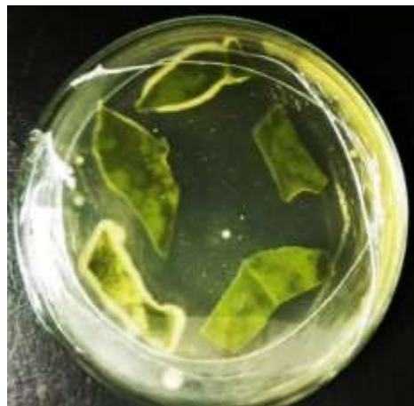
Gambar 1. Hasil isolasi bakteri endofit.

Isolasi bakteri endofit dilakukan pada media padat nutrient agar (NA) dimana bakteri endofit ditunjukkan dengan adanya daerah keruh di sekitar sampel seperti pada Gambar 1.