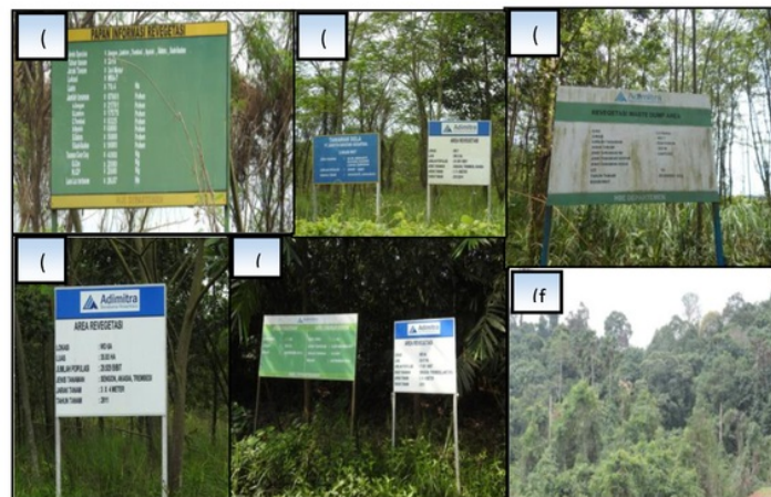
Gambar 3. Lahan (a) Revegetasi umur 3 tahun; (b) Revegetasi umur 4 tahun; (c) Revegetasi umur 5 tahun; (d) Revegetasi umur 6 tahun; (e) Revegetasi umur 7 tahun; (f) Hutan sekunder di PT Adimitra Baratama Nusantara.

Kawasan revegetasi pasca tambang PT ABN ditanami beberapa jenis tanaman yang cepat tumbuh ( fast growing species ) seperti akasia ( Acacia mangium ), sengon laut ( Falcataria mollucana ), trembesi ( Samanea saman ), dan lamtoro ( Leucaena leucocephala ). Deskripsi areal revegetasi pasca tambang berbeda umur PT ABN ditampilkan pada Gambar 3.