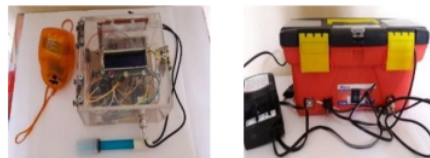
Gambar 2. Media Penentu Asam Basa

Bentuk media yang diperoleh setelah perancangan pada penelitian ini dapat dilihat pada gambar 2 berikut: