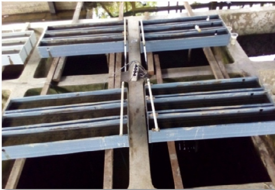
Gambar 1. Wadah kultur cacing sutra

Presentase lumpur ditambah pupuk kandang pada perlakuan adalah persen dari total berat media keseluruhan, sedangkan perbandingan lumpur dan pupuk kandang dibuat tetap sama sehingga komposisi media 100%.