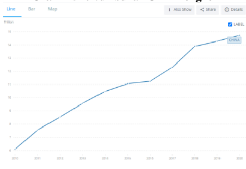
Grafik 1. Pertumbuhan GDP Tiongkok

Fenomena rivalitas Amerika Serikat dan Tiongkok muncul karena adanya kebangkitan Tiongkok yang menjadikan sebagai kekuatan baru. Kebangkitan Tiongkok ini diikuti oleh kebijakan luar negeri yang bagi banyak negara, termasuk negara kekuatan besar, dirasa agresif dan impulsif baik secara militer maupun ekonomi.